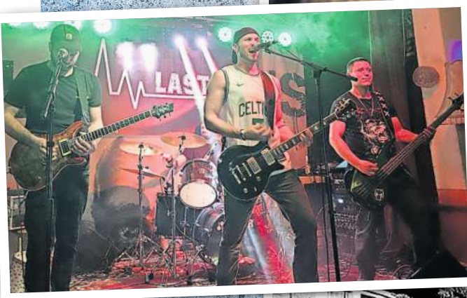
Die Kyritzer Band Last Line spielt auf heimischem Boden.