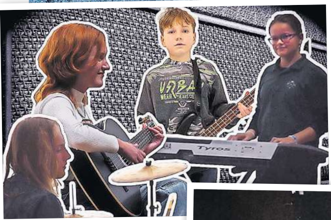
Die Schülerband Fomo hat am 9. März ihren ersten großen Auftritt.

400 Euro wurden damals an den Verein Ostprignitz-Jugend e.V. gespendet, der sich seit Jahren für die Belange von Familien in Kyritz engagiert. Eine solche Spendenaktion wollen die Veranstalter auch in diesem Jahr wieder durchführen. Dieses Mal soll die Spende an die Trauergruppe „Lumina“ gehen. „Lumina“ ist ein Angebot des Ruppiner Hospiz und bietet Trauerbegleitung für Kinder und Jugendliche. Unterstützt wird die Rocknacht in diesem Jahr von der Sparkasse OPR, dem Autohaus Füllgraf in Kyritz, dem Mehrgenerationenhaus und der Stadt Kyritz. Gabriele Elstermann