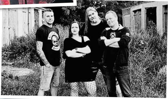
Die Band Garage Rockz reist aus Mecklenburg-Vorpommern an.