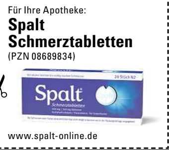
Abbildung Betroffenen nachempfunden. SPALT SCHMERZTABLETTEN. Für Erwachsene bei: akuten leichten bis mäßig starken Schmerzen. Schmerzmittel sollen längere Zeit oder in höheren Dosen nicht ohne Befragen des Arztes angewendet werden. Bei Schmerzen oder Fieber ohne ärztlichen Rat nicht länger anwenden als in der Packungsbeilage vorgegeben! www.spalt-online.de • Zu Risiken und Nebenwirkungen lesen Sie die Packungsbeilage und fragen Sie Ihre Ärztin, Ihren Arzt oder in Ihrer Apotheke. • PharmaSGP GmbH, 82166 Grafelfing

Abbildungen Betroffenen nachempfunden. RUBAXX SCHMERZGEL. Wirkstoff: Rhus toxicodendron D1, D6. Homöopathisches Arzneimittel bei Besserung rheumatischer Schmerzen und Folgen von Verletzungen und Überanstrengungen. • RUBAXX. Wirkstoff: Rhus toxicodendron D1, D6. Homöopathisches Arzneimittel bei rheumatischen Schmerzen in Knochen, Knochenhaut, Gelenken, Sehnen und Muskeln und Folgen von Verletzungen und Überanstrengungen. www.rubaxx.de • Zu Risiken und Nebenwirkungen lesen Sie die Packungsbeilage und fragen Sie Ihre Ärztin, Ihren Arzt oder in Ihrer Apotheke. • PharmaSGP GmbH, 82166 Grafelfing