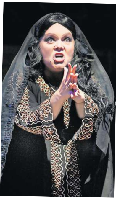
Die prachtvolle Oper „Nabucco“ wird im Ziegeleipark Mildenberg aufgeführt.

☛ Weitere Informationen und Karten an allen örtlich bekannten Vorverkaufsstellen und unter www.paulis.de , per E-Mail: tickets@paulis.de oder Tel. 0531/346372.