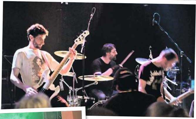
Die Gruppe Belt kommt aus Berlin.

Garage Rockz Die Band aus Mecklenburg-Vorpommern hat sich aufs Covern spezialisiert. Den rauen Wind des kühlen Nordens kann man in den Songs der drei Männer um Frontfrau Claudi förmlich spüren. Schwerer Gitarrensound trifft hier auf Werke von Deep Purple bis Christina Aguilera. Die Musiker aus Parchim haben dabei viele ungewöhnliche Songs im Repertoire, die man nicht auch ständig von anderen Coverbands hört.