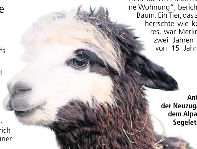
Antonio ist der Neuzugang auf dem Alpakahof in Segeletz.