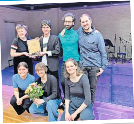
Das Kollektiv Unruhe hat die vierköpfige Jury mit seinem Spiel überzeugt.

Das Rheinsberger Residenzensemble für neue Musik des Akademiejahres 2024/25 ist das Kollektiv Unruhe.