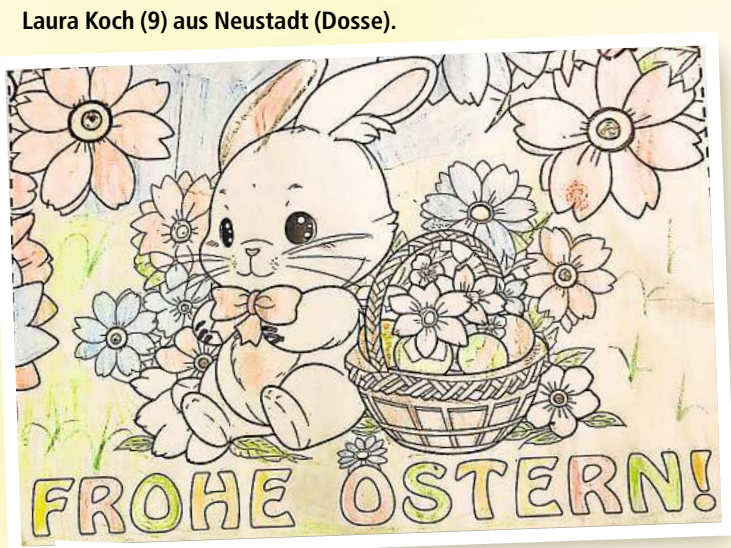
Laura Koch (9) aus Neustadt (Dosse).