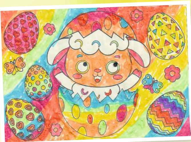
Greta Bohn (7) aus Groß Lüben.