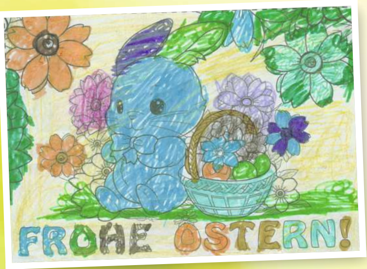
Merve Polat (5) aus Wusterhausen/Dosse.