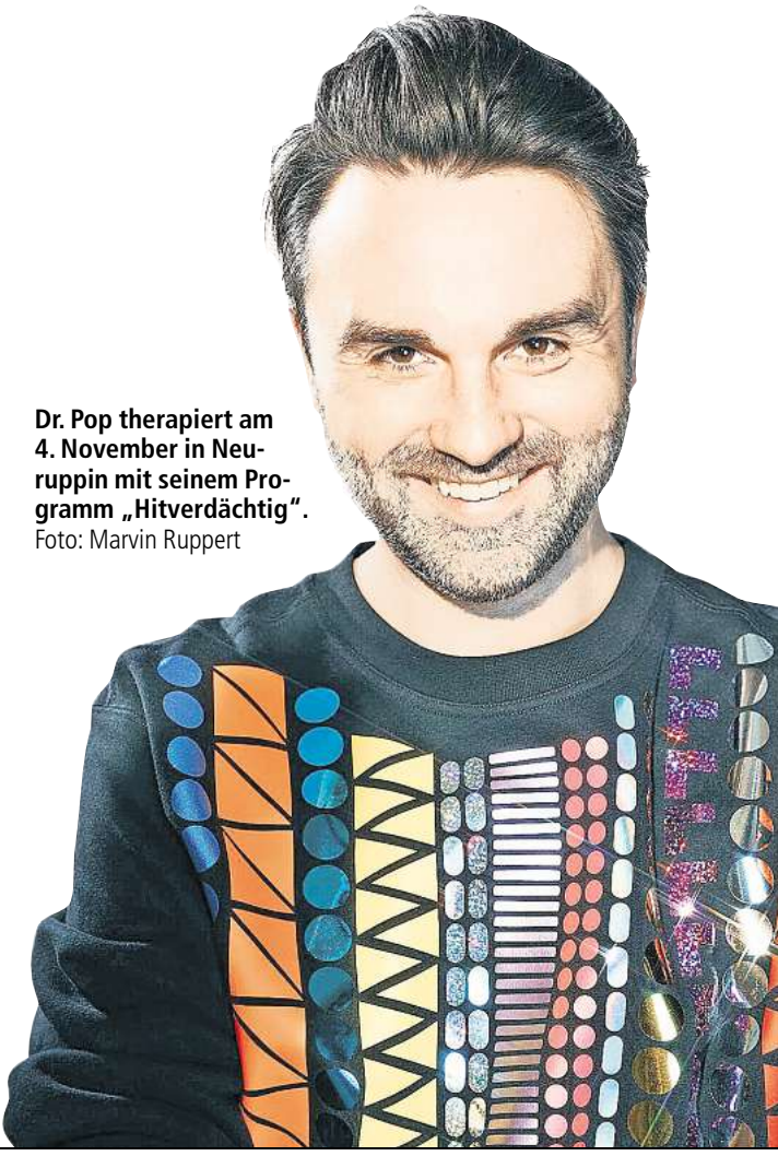
Dr. Pop therapiert am 4. November in Neuruppin mit seinem Programm „Hitverdächtig“.

Dr. Pop: Hitverdächtig. 4. Januar, 20 Uhr, Kulturhaus Neuruppin