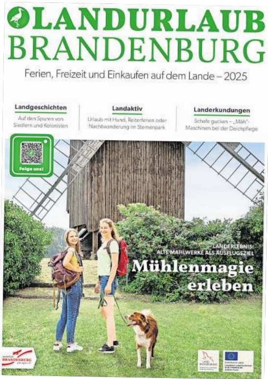
Der neue Katalog „Landurlaub Brandenburg“.

PAAREN IM GLIEN. Pünktlich zur Vorbereitung auf die kommenden Reisesaison veröffentlicht der Verband pro agro den Katalog „Landurlaub Brandenburg 2025“. Wie es heißt, lade der Katalog dazu ein, Brandenburg auf eine neue Weise zu erleben – ob bei einem romanti-