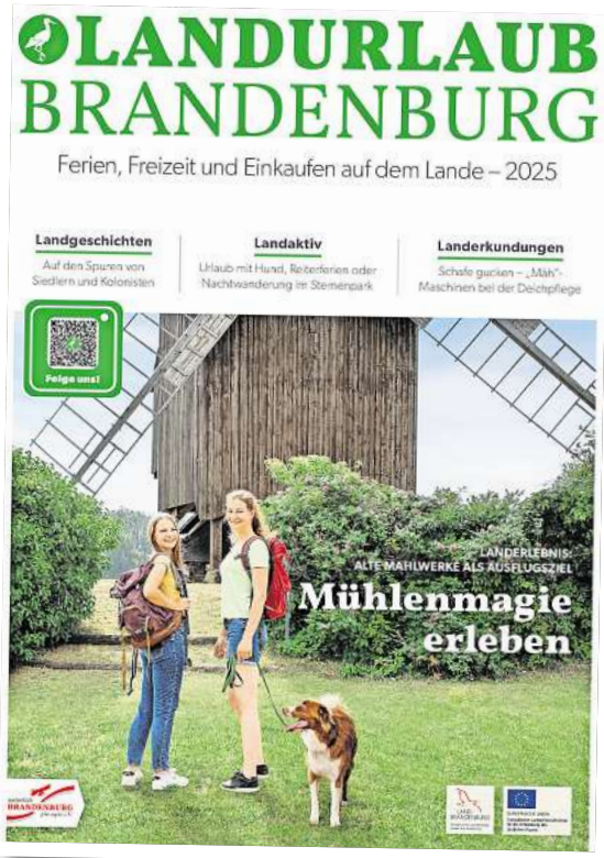
Der neue Katalog „Landurlaub Brandenburg“.

PAAREN IM GLIEN. Pünktlich zur Vorbereitung auf die kommenden Reisesaison veröffentlicht der Verband pro agro den Katalog „Landurlaub Brandenburg 2025“. Wie es heißt, lade der Katalog dazu ein, Brandenburg auf eine neue Weise zu erleben – ob bei einem romanti-