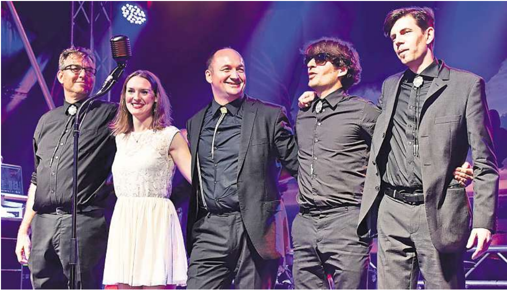
Sie huldigen in ihrer Liveshow dem Sound von Jonny Cash: „The LineWalkers“ bringen das Publikum gerne zum tanzen.

„The LineWalkers“ lassen in der Kulturscheune die Musik von Johnny Cash aufleben