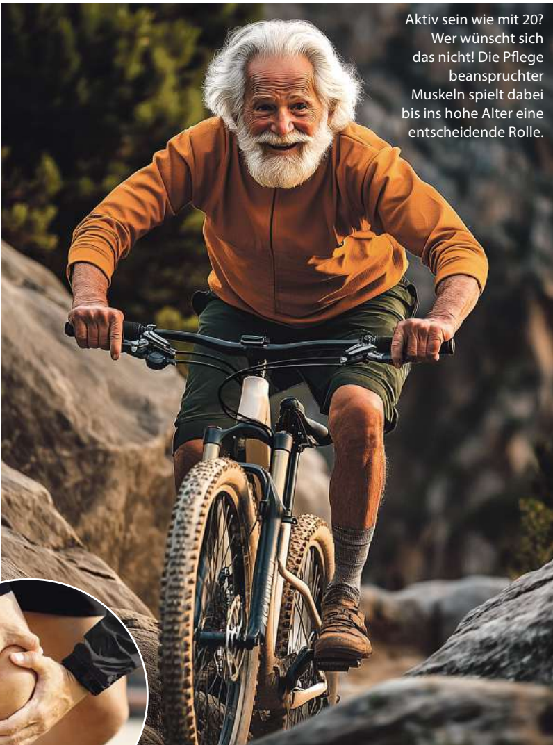
Aktiv sein wie mit 20? Wer wünscht sich das nicht! Die Pflege beanspruchter Muskeln spielt dabei bis ins hohe Alter eine entscheidende Rolle.

Hochdosiertes Cannabis CBD Gel begeistert Anwender