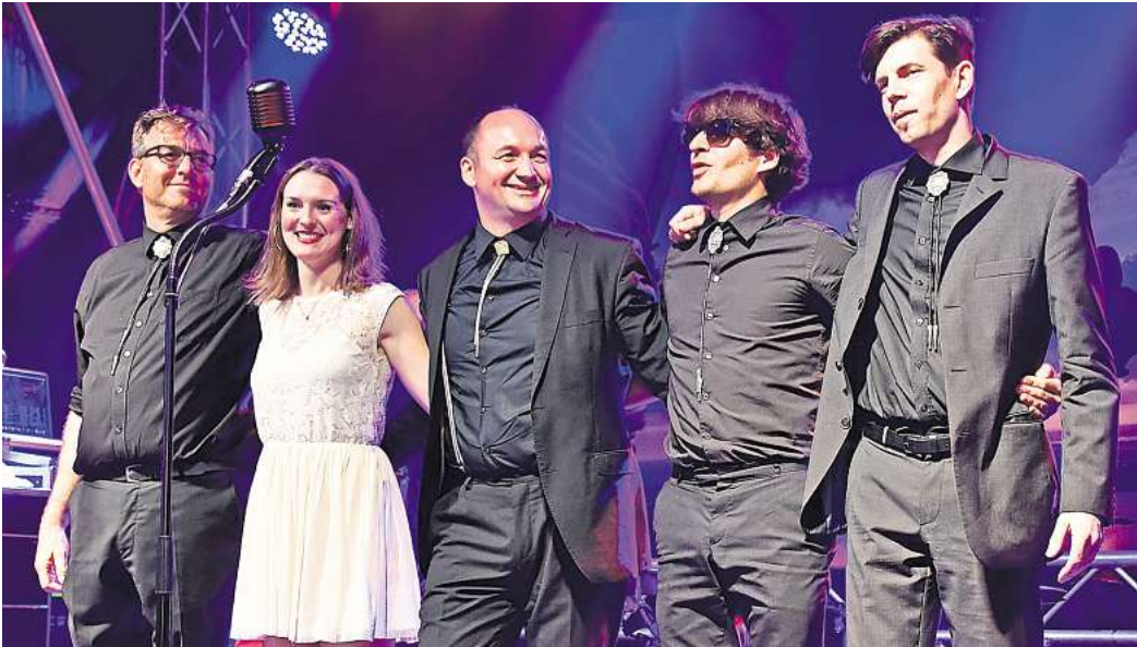
Sie huldigen in ihrer Liveshow dem Sound von Jonny Cash: „The LineWalkers“ bringen das Publikum gerne zum tanzen.

„The LineWalkers“ lassen in der Kulturscheune die Musik von Johnny Cash aufleben