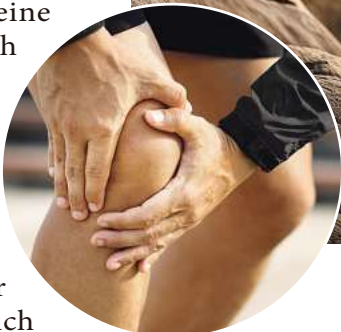
Das CBD Gel enthält Menthol und Minzöl für beanspruchte Muskeln.