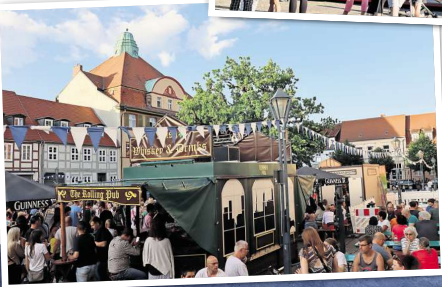
In Kyritz wird vom 27. bis 29. Juni das traditionelle Altstadtfest gefeiert.