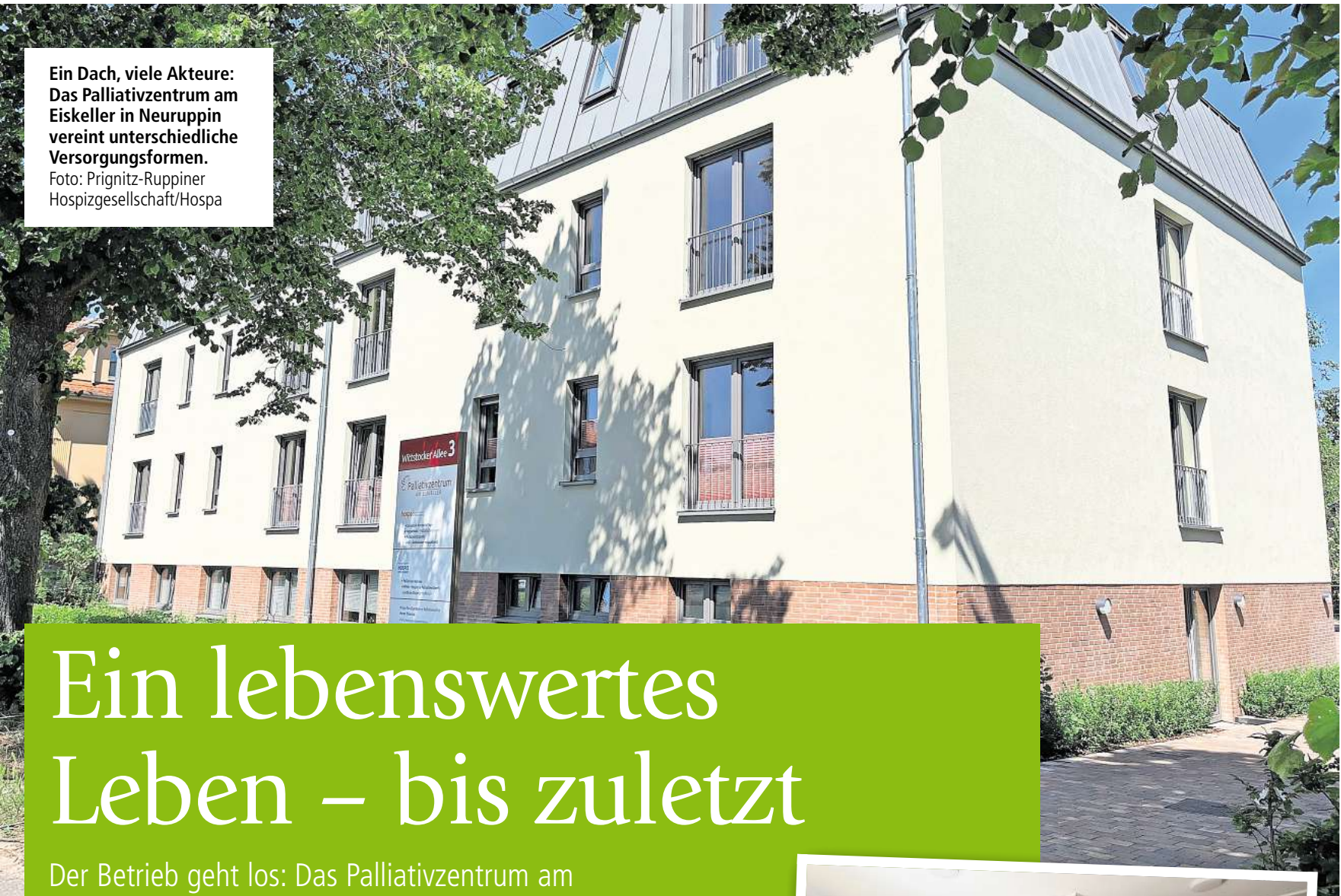
Ein Dach, viele Akteure: Das Palliativzentrum am Eiskeller in Neuruppin vereint unterschiedliche Versorgungsformen.