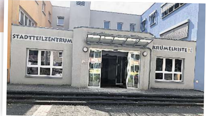
Seit heute finden die DRK-Blutspendetermine im Mehrgenerationenhaus in Neuruppin statt. Foto: DRK

Kleiner Piks: Blutspender während der Blutabnahme. Foto: DRK/Yannik Willing sche Spendeort liegt verkehrsgünstig ganz in der Nähe der Klinik. Am heutigen 4. Oktober findet die DRK-Blutspende erstmals am neuen Standort statt – im Soziokulturellen Zentrum „Krümelkiste“ in der Otto-Grotewohl-Straße 1a. Der Sondertermin an einem Samstag hilft, die Patientenversorgung mit lebensrettenden Blutpräparaten zu Monatsbeginn nach dem Feier- und Brückentag am 3. Oktober zu sichern.