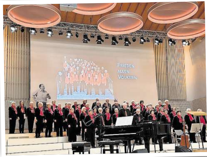
Der Ernst-Busch-Chor gibt am 12. Oktober ab 16 Uhr ein Konzert in der Rheinsberger Laurentiuskirche.

11. und 12. Oktober: Kleine Orgelkonzerte und Chorkonzert in der St.-Laurentius-Kirche in Rheinsberg