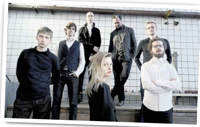
Das Ensemble Kymatic verbindet elektronische Musik mit von einer KI generierten Bildern.

Das Aduma-Quartett spielt am 25. Oktober in Rheinsberg beim Wochenende der neuen Musik.