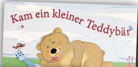
Cover: Verlag (2)

Lorenz, S.; Romoth, H.: Annabell und der Duft des Waldes, Hechtsprungverlag, 2025. Kam ein kleiner Teddybär. Eulenspiegel Kinderbuchverlag Berlin, 2024.