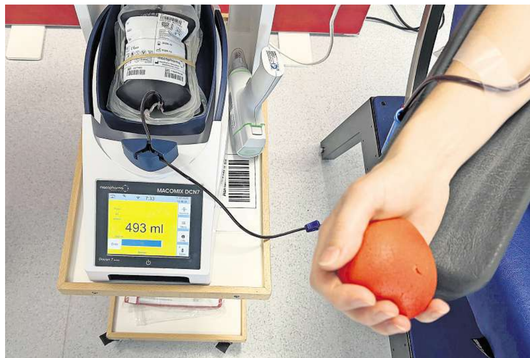
500 Milliliter Blut werden bei einer Spende maximal entnommen. Das dauert meistens zwischen acht und zehn Minuten.