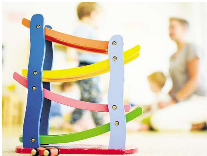
Nicht immer ist die eigene Familie der beste Ort für ein Kind. Pflegefamilien sind dann eine optimale Lösung.

Hierzu findet am Dienstag, dem 11. November, ab 16.15 Uhr bis etwa 18 Uhr beim Landkreis OPR im Amt für Familien und Jugend (Heinrich-Rau-Straße 27-30 in Neuruppin, Raum 203) ein unverbindlicher Infoabend für Interessierte statt. Eine vorherige Anmeldung ist erwünscht, entweder per E-Mail an pflegekinderdienst@opr.de oder telefonisch unter 03391/688-5116, -5146, -5162, oder -5181. WS