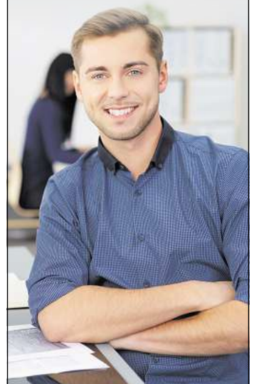
WOCHENSPIEGEL - STELLENMARKT

Wir beraten Sie gern: 0331 / 28 40 404 anzeigen@wochenspiegel-brb.de