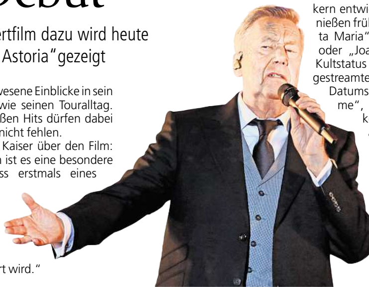
Roland Kaiser prägt seit fünf Jahrzehnten die deutsche Popmusik.

Roland Kaiser über den Film: „Für mich ist es eine besondere Ehre, dass erstmals eines meiner Konzerte auf der großen Kinoleinwand präsentiert wird.“