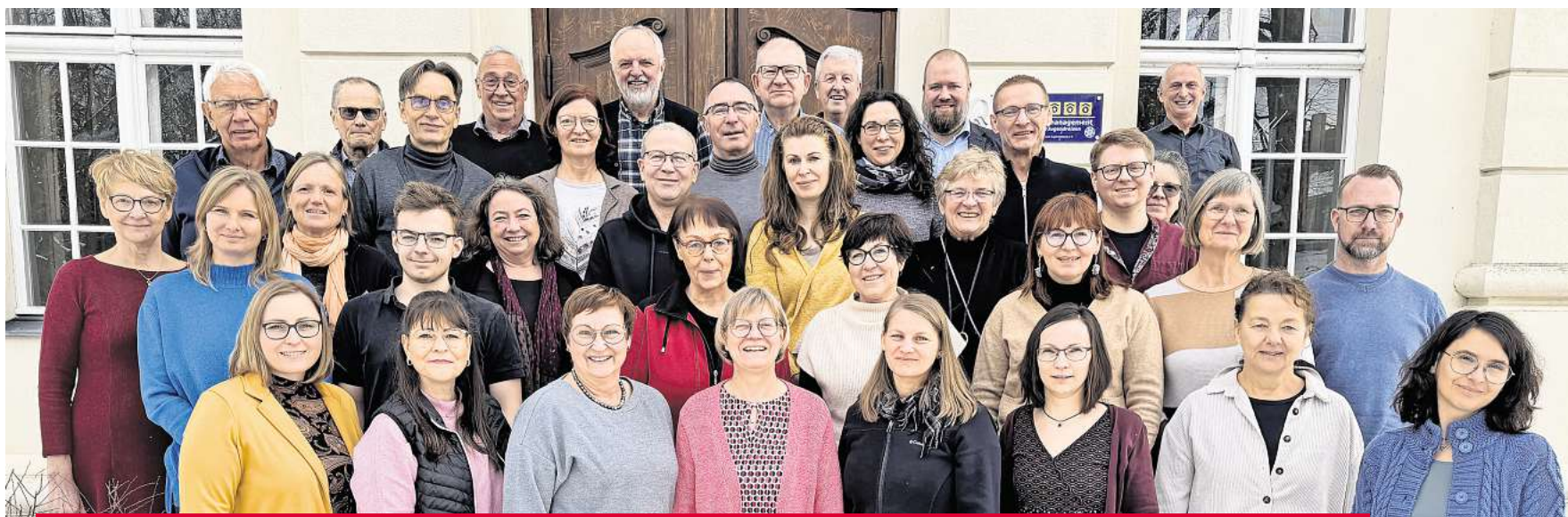
Der Neuruppiner A-cappella-Chor: Das Foto entstand bei einem winterlichen Probenwochenende im brandenburgischen Gollwitz.

Am morgigen Sonntag, 7. Dezember, findet dann ab 17 Uhr die beliebte Adventchorgala in der Kulturkirche Neuruppin statt, mit sechs verschiedenen Chören aus Neuruppin und dem A-cappella-Chor als Gastgeber. Chorleiter Nils Jensen bringt auf den Punkt, weshalb sich ein Besuch lohnt: „Die alljährliche Adventchorgala zeigt die erstaunliche Vielfalt und Lebendigkeit der Neuruppiner Chorszene. Zwei Jugendchöre demonstrieren eindrucksvoll die Freude an innovativer Chormusik, während die Erwachsenenchöre unterschiedlichste Ansätze des Chorsingens repräsentieren. Als Leiter des A-cappella-Chores freue ich mich, dass ich