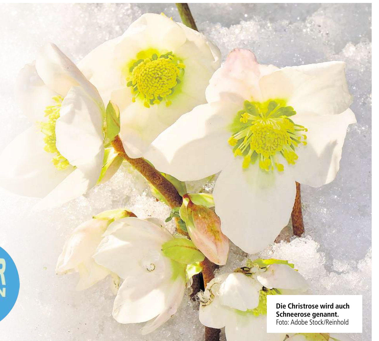
Die Christrose wird auch Schneerose genannt.