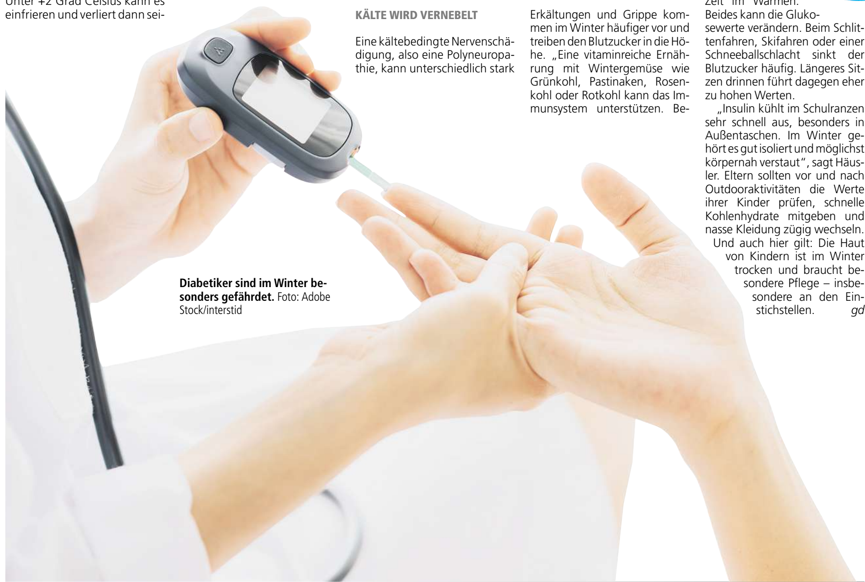
Diabetiker sind im Winter besonders gefährdet.