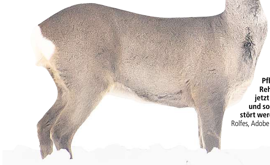
Pflanzenfresser wie Rehe befinden sich jetzt im Ruhemodus und sollten nicht gestört werden.

Haferflocken oder Apfelstücke an einem trockenen, katzensicheren Platz. Gar nicht gut: Ambrosia-Samen. ▶ Allesfresser auf Distanz halten: Biomüll und Gartenabfälle sollten für Wildschwein, Fuchs oder Waschbär unerschwinglich sein – so werden Probleme vermieden. ▶ Ruhe bewahren: Pflanzenfresser im Energiesparmodus reagieren im Spätwinter besonders empfindlich auf Störungen, deshalb am besten auf den Wegen bleiben und Beunruhigungen vermeiden. WS