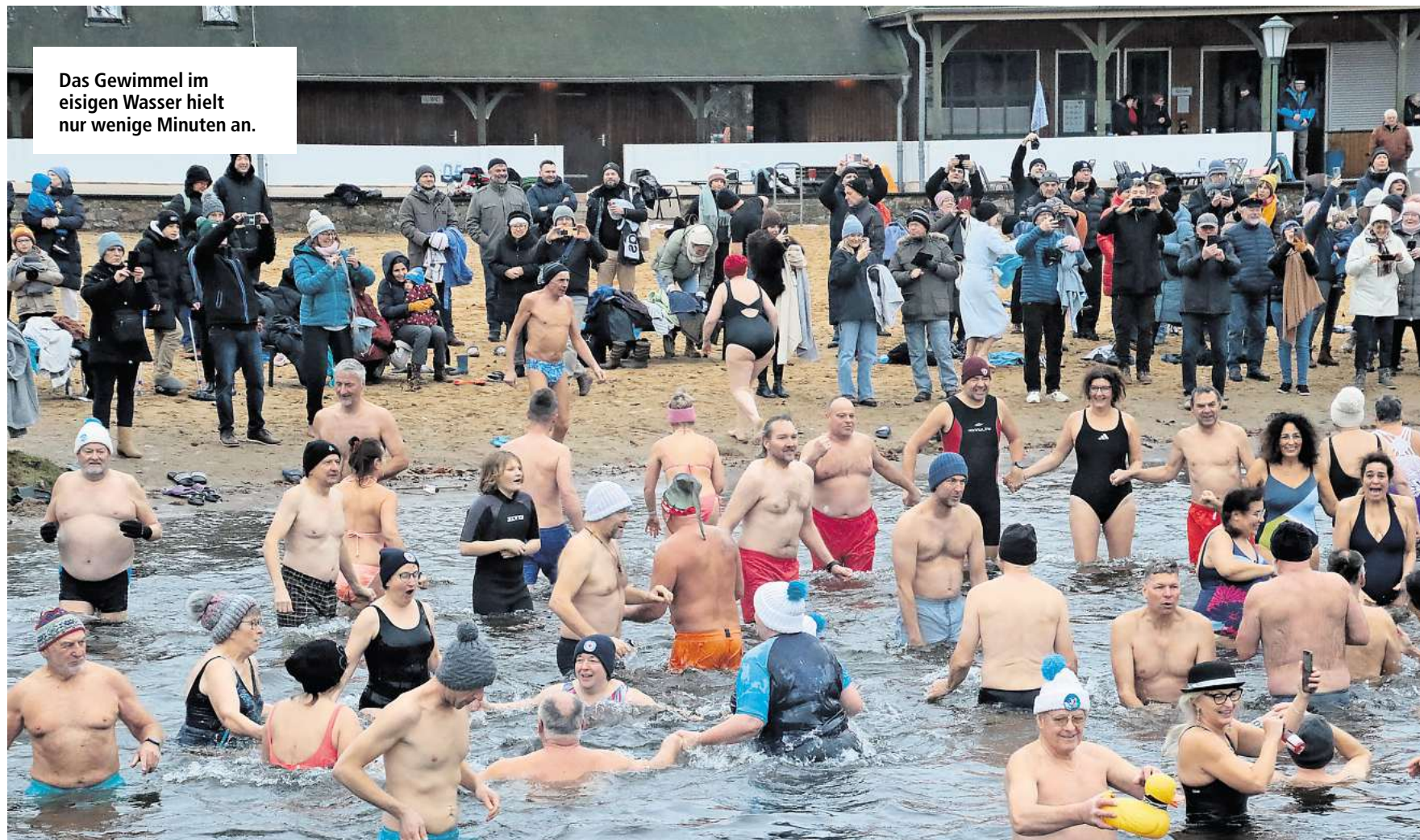
Das Gewimmel im eisigen Wasser hielt nur wenige Minuten an.