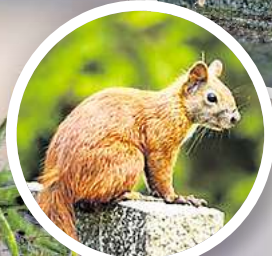
Zitronenfalter, Bunter Kugelspringer und Eichhörnchen.