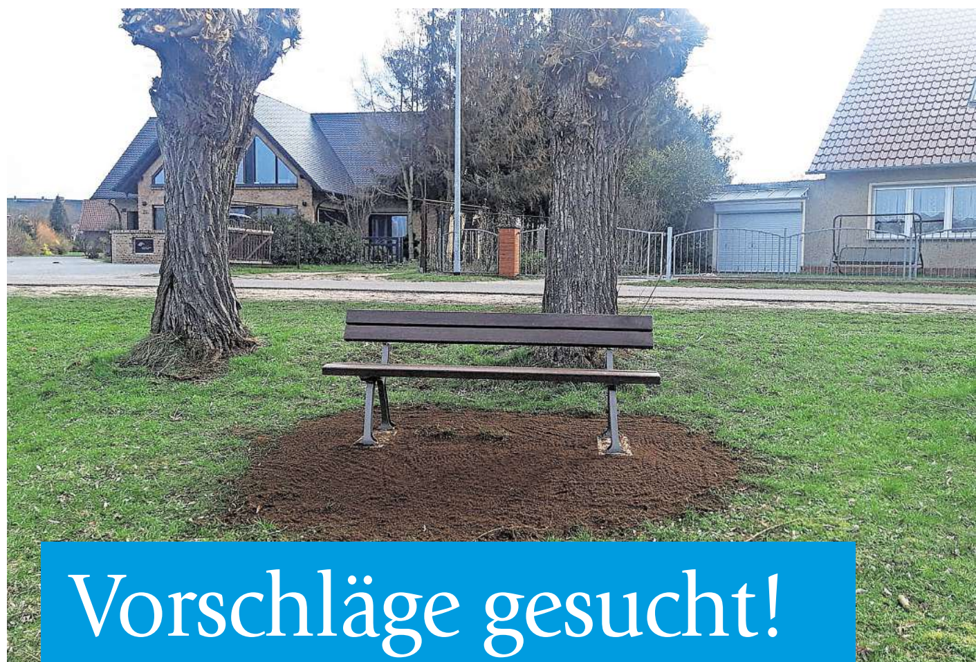
Im Jahr 2023 wurden durch den Kyritzer Bürgerhaushalt u. a. Bänke im Ortsteil Gantikow finanziert.