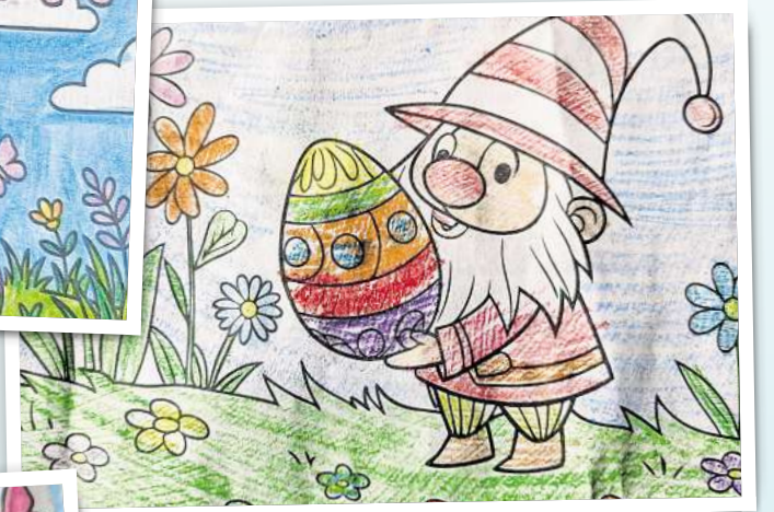
Ilana Lübke, 10 Jahre, aus Wittstock/Dosse.