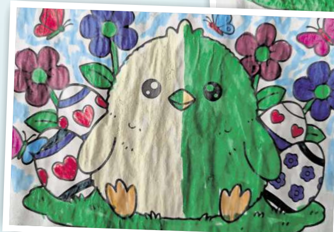
Theodor Kong, 8 Jahre, aus Weisen.