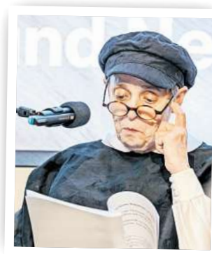
Katharina Thalbach liest.