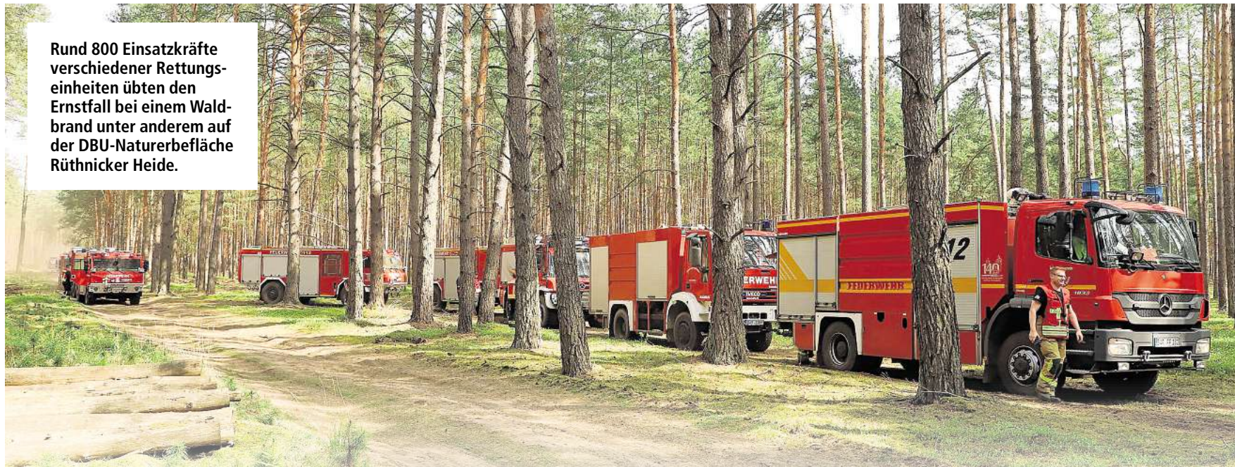
Rund 800 Einsatzkräfte verschiedener Rettungseinheiten übten den Ernstfall bei einem Waldbrand unter anderem auf der DBU-Naturerbefläche Rühnicker Heide.