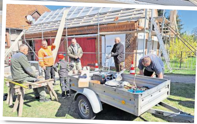
Bei einem gemeinsamen Arbeitseinsatz wurde das Dach des Feuerwehrgerätehauses in Biesen wieder instand gesetzt.

Möglich war dies durch gesponsertes Arbeitsmaterial wie Bauholz und Dachziegel. Die Steine wurden durch einen kleinen Trupp gesäubert und so wieder verwendbar gemacht.