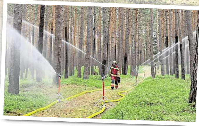
fügen, der zusammen mit ätherischen Ölen als Brandbeschleuniger wirken könne.

Die DBU-Naturerbefläche Rühnicker Heide ist durch ein großes, geschlossenes Waldgebiet charakterisiert. Neben einem Eichenwald im Zentrum charakterisieren ausgedehnte Kiefernforste die Fläche. „Nadelbäume sind grundsätzlich etwas feueranfälliger als Laubbäume. Zum einen gelangt durch die lichte Kiefernkrone viel Sonnenlicht auf den Boden, was ihn schnell austrocknet. Zum anderen brennen die trockenen Nadeln von Kiefern gut“, beschreibt Christian Sürie, Leiter Betriebsmanagement im DBU Naturerbe. Hinzu komme, dass Nadelbäume über einen großen Harzanteil ver-