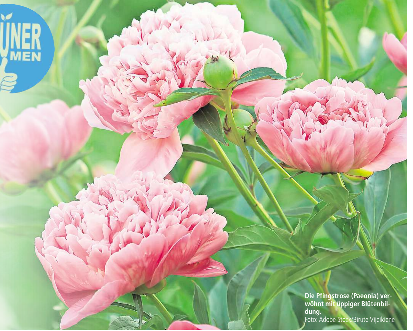
Die Pfingstrose (Paeonia) veröhnt mit üppiger Blütenbildung.