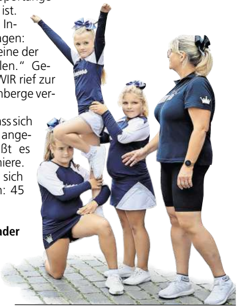
Die Princess Cheerleader beim Stadt- und Hafenfest 2022 in Wittenberge