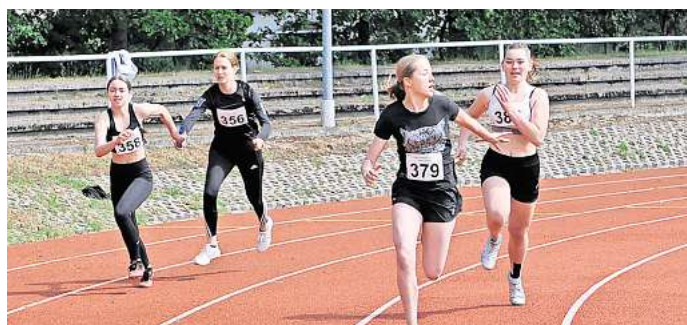
Jugend trainiert für Olympia.

sich seit 16 Jahren um JtFO-Wettkämpfe kümmert, ist sehr zufrieden mit dem Meldeergebnis – auch in den anderen noch anstehenden olympischen