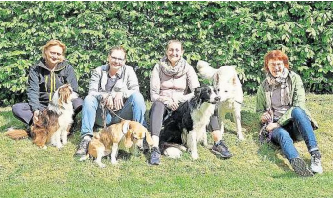
Das Agility-Team der Prignitzer Agi-Flitzer.

Prignitzer Agi-Flitzer laden Hundesport-Community zum Wettkampf ein