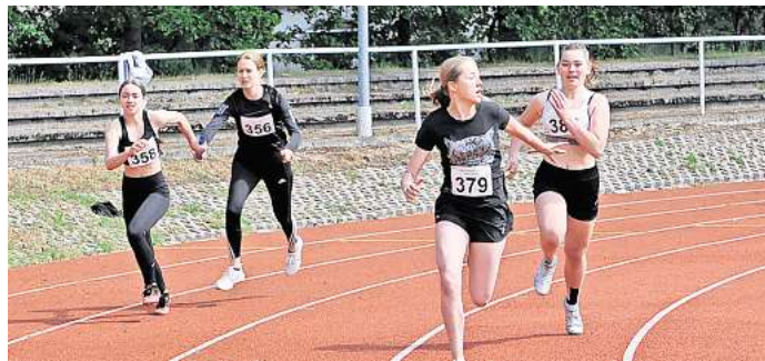
Jugend trainiert für Olympia.

sich seit 16 Jahren um Jtfo-Wettkämpfe kümmert, ist sehr zufrieden mit dem Meldeergebnis – auch in den anderen noch anstehenden olympischen