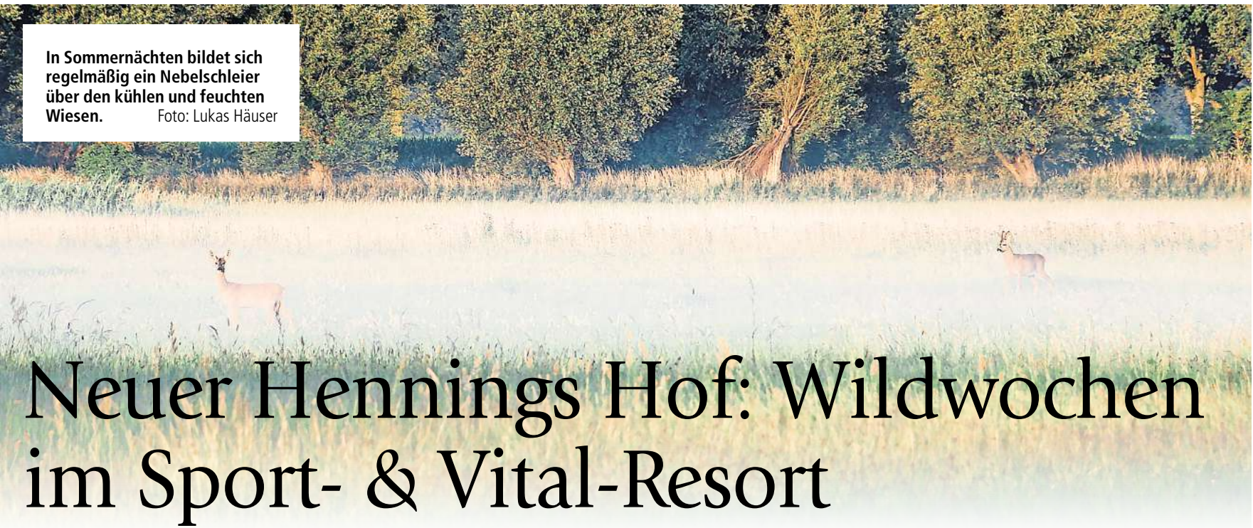
In Sommernächten bildet sich regelmäßig ein Nebelschleier über den kühlen und feuchten Wiesen.