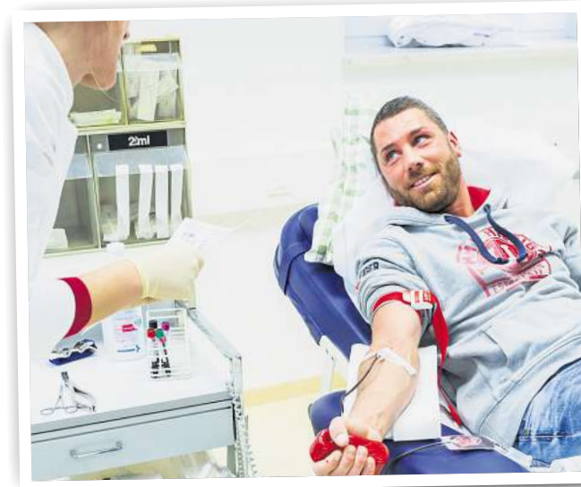
Die Blutspende lässt sich leicht in den Alltag integrieren.