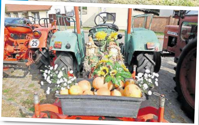
Das Dorf feiert: Mit Traktoren und vielen Vergnügungen für Groß und Klein.

Die Heimatstube findet man in der Wilhelm-Pieck-Straße 57. Das ehemalige Bauerngehöft zeigt Ausstellungen zur Dorfgeschichte: eine zeitgeschichtliche