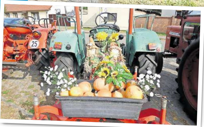
Das Dorf feiert: Mit Traktoren und vielen Vergnügungen für Groß und Klein.

Die Heimatstube findet man in der Wilhelm-Pieck-Straße 57. Das ehemalige Bauerngehöft zeigt Ausstellungen zur Dorfgeschichte: eine zeitgeschichtliche