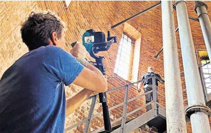
Dreharbeiten im Wittenberger Wasserturm – nicht nur sprichwörtlich ein Höhepunkt der Landesgartenschau 2027.

sich das Kerngebiet der Landesgartenschau bis dahin verändern wird, gibt ein Film, der in Zusammenarbeit mit dem Unternehmen Prignitzer Medien und der Stadtverwaltung Wittenberge in den vergangenen Wochen produziert wurde. Interessierte finden den Filmbeitrag auf der Internetseite der Stadt Wittenberge unter dem Menüpunkt LAGA 2027. WS