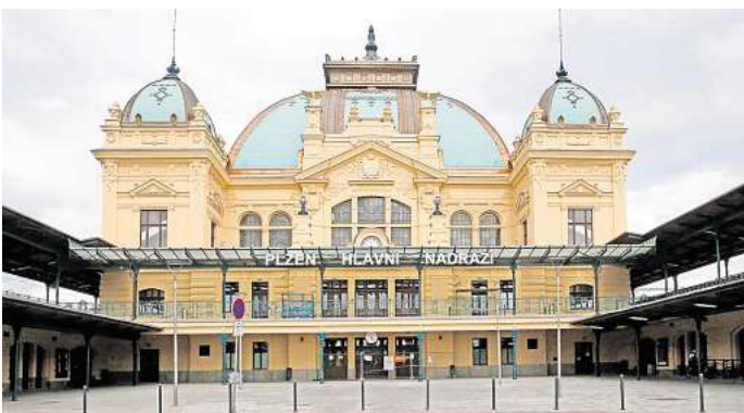
Der Bahnhof in Pilsen wurde 1907 eingeweiht.

Vor 200 Jahren wurde der Wiener Städtische Versicherungsverein offiziell gegründet. Und im selben Jahr wurde in England zwischen Stockton und Darlington die weltweit erste Eisenbahnlinie eröffnet, ein Jahr später dort der erste Bahnhof gebaut. Grund genug für den Verein, in seiner jährlichen Sommerausstellung in diesem Jahr Bahnhöfe als Stationen in Europa zu präsentieren. Eisenbahnfans und Architekturliebhaber können daran teilhaben, denn der Verlag Mury Salzmann hat dazu einen sehr repräsentativen Katalog gestaltet. Den ersten großen Bahnstrecken des Kontinentes folgten bald weitere Bahnhöfe nicht nur zur Abfertigung und zum Schutz der Reisenden, sondern als beeindruckende architektonische Zeugnisse des Industriezeitalters. Die zunächst bescheidenen Klein- und Mittelstadtbahnhöfe beeinflussten das Bild der wachsenden Städte immer mehr. Bahnhofstraßen wurden angelegt, aus Baumalleen erwachsen Bummelmeilen, und heutzutage sind es weiträumige Galerien und Einkaufszentren, die neue Sinneseindrücke vermitteln. „Großer Bahnhof“ ist durchaus nicht nur sinnbildlich zu verstehen, sondern wird auch den Hallen gerecht, die in der Literatur als Kathedralen des 19. Jahrhunderts, als Basiliken der Technik bezeichnet worden sind. Die