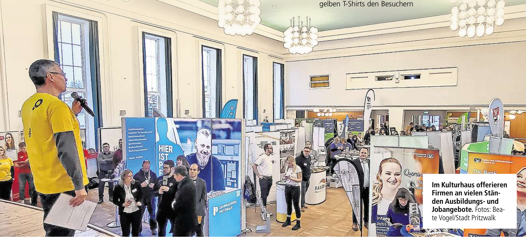
Im Kulturhaus offerieren Firmen an vielen Ständen Ausbildungs- und Jobangebote.