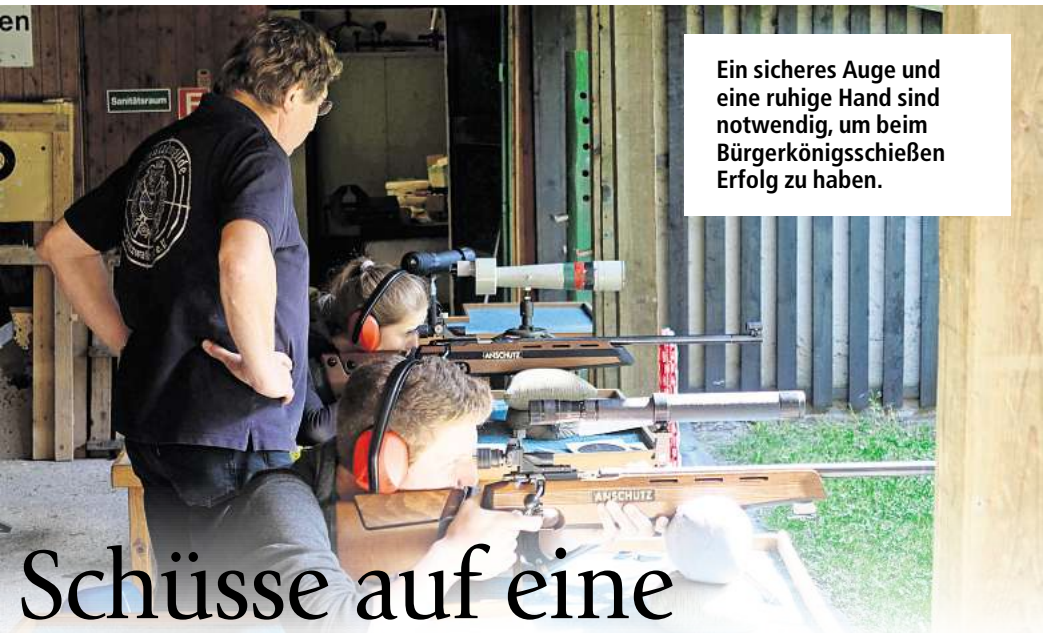
Ein sicheres Auge und eine ruhige Hand sind notwendig, um beim Bürgerkönigsschießen Erfolg zu haben.