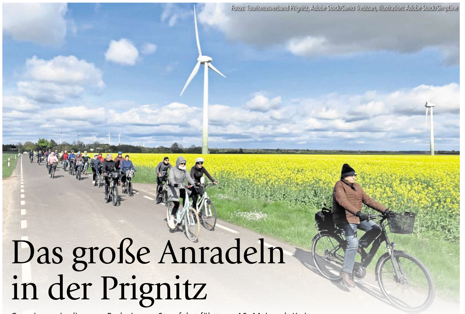
Fotos: Tourismusverband Prignitz, Adobe Stock/Samo Trebizan, Illustration: Adobe Stock/SimpLine