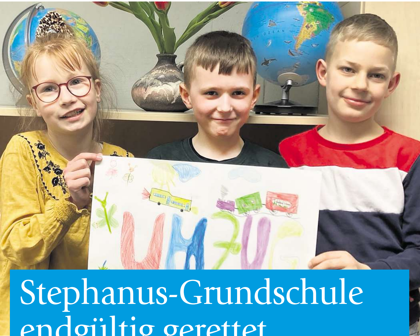
Zuversichtliche Stimmung in der 3. Klasse der Evangelischen Grundschule Pritzwalk.

drei Wochen einen neuen Träger finden konnten und sich gleichzeitig eine Gebäudelösung ergab: Ab September ziehen wir in das alte Schulgebäude am Perleberger Tor 4. Auch hier sind kleine bauliche Veränderungen von Nöten, sodass die bisher gesammelten Gelder gut eingesetzt werden.“