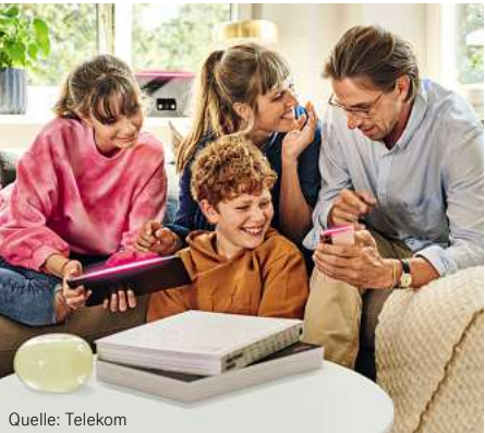
Für rund 5.600 Haushalte in Pritzwalk baut die Telekom gemeinsam mit der GlasfaserPlus Glasfaserleitungen aus.

Zur Nutzung des Glasfaser-Anschlusses ist die Buchung eines Glasfaser-Tarifs notwendig. Die Telekom bietet hierbei verschiedene Geschwindigkeiten an. Im Aktionszeitraum erhalten Sie attraktive Angebote auf die Glasfaser-Tarife der Telekom! Sie gehören dann zu den Ersten, die an das schnelle neue Netz angeschlossen werden. Gut zu wissen: Die Glasfaser-Tarife der Telekom bieten viel Bandbreite zum fairen Preis. Dabei profitieren Sie mit Glasfaser auch von einer hohen Upload-Geschwindigkeit. Diese entspricht immer der Hälfte der gebuchten Download-Ge-