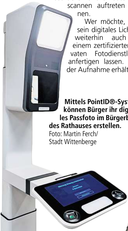
Mittels PointID®-System können Bürger ihr digitales Passfoto im Bürgerbüro des Rathauses erstellen.

nicht mehr akzeptiert und können im Antragsverfahren nicht mehr verarbeitet werden. Die digitalen Lichtbilder müssen entweder direkt in der Behörde aufgenommen oder von einem Fotostudio in eine sichere Cloud hochgeladen werden. Ziel ist es, den Prozess der Ausweisbeantragung zu vereinfachen und gleichzeitig die Sicherheit der Dokumente zu