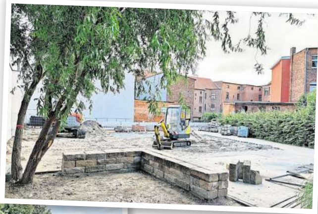
Der neue Bürgergarten in Wittenberge entsteht.

Auf dem Schulhof der Jahn-schule wurde ein neuer Niedrig-seilgarten installiert, der die vor-handenen Spielmöglichkeiten ergänzt. Darüber hinaus erhielt der Spielbereich eine neue Kies-schicht als Untergrund und der Sandkasten wurde mit einem