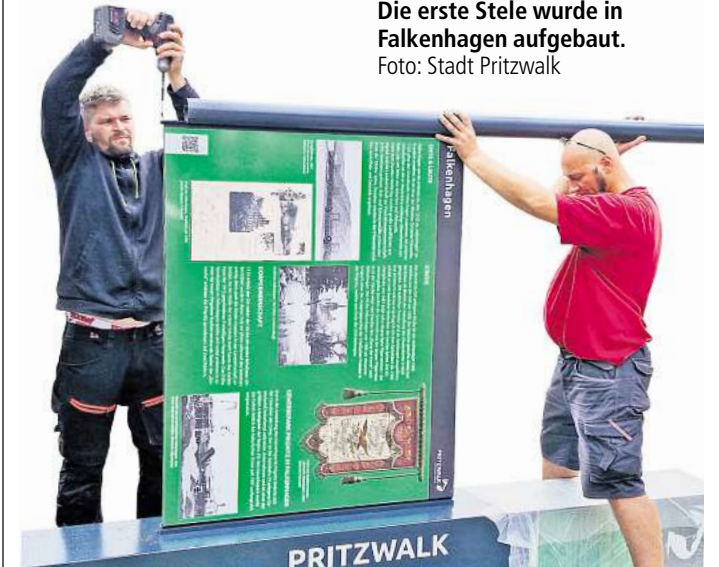
Die erste Stele wurde in Falkenhagen aufgebaut.

kennbar. In diesem Design sind auch die insgesamt 18 Ortsteilschilder aufgebaut. Auf der Vorderseite finden sich auf grünem Grund historische Informationen, angereichert mit zeitgenössischen Aufnahmen aus dem jeweiligen Dorf. Sie reichen etwa bis zur Wendezeit um 1990. Auf der Rückseite gibt es einen Ortsplan, der auch über die Lage des Ortsteils im Stadtgebiet Pritzwalk informiert. Ein QR-Code führt außerdem auf die Webseite der Stadt Pritzwalk, wo es kleine Porträts des jeweiligen Ortsteils gibt.