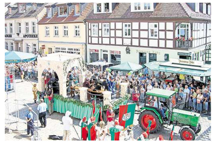
Einen riesigen Festumzug gab es zum Stadtjubiläum 750 Jahre Pritzwalk im Jahr 2006.

Zu jedem großen Stadtjubiläum gehört ein großer Festumzug. Er ist in Pritzwalk für Samstag, den 13. Juni 2026, geplant. „Jeder kann sich gern einbringen, ob Verein, Kindereinrichtung, Ortsbeirat, Dorfgemeinschaft, Unternehmen, und und und ... Wichtig ist, dass sich interessierte Teilnehmerinnen und Teilnehmer beim Organisationsteam anmelden und vorstellen“, so die Veranstalter. Für die Teilnahme am Festumzug gibt es ein Anmeldeformular (dieses kann man online ausfüllen, dann auf dem eigenen Gerät speichern und ausdrucken), das auf der Webseite der Stadt hinterlegt ist. dre