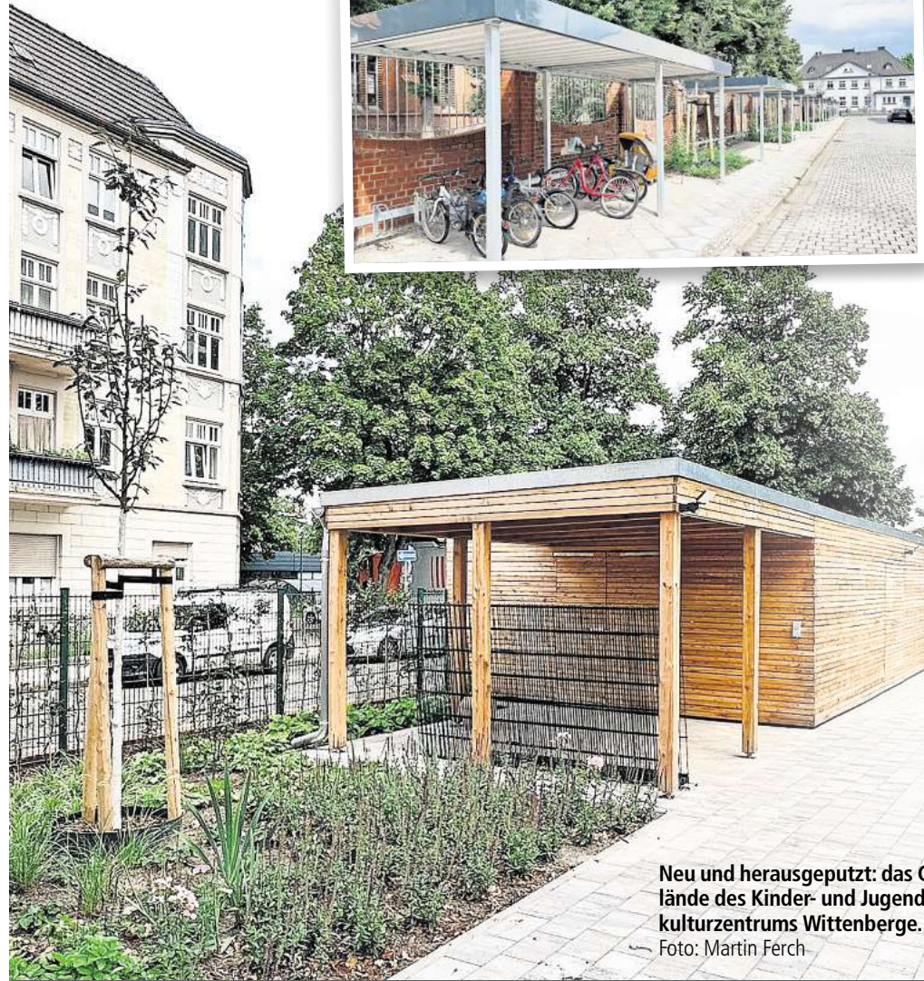
Neu und herausgeputzt: das Gelände des Kinder- und Jugendkulturzentrums Wittenberge.