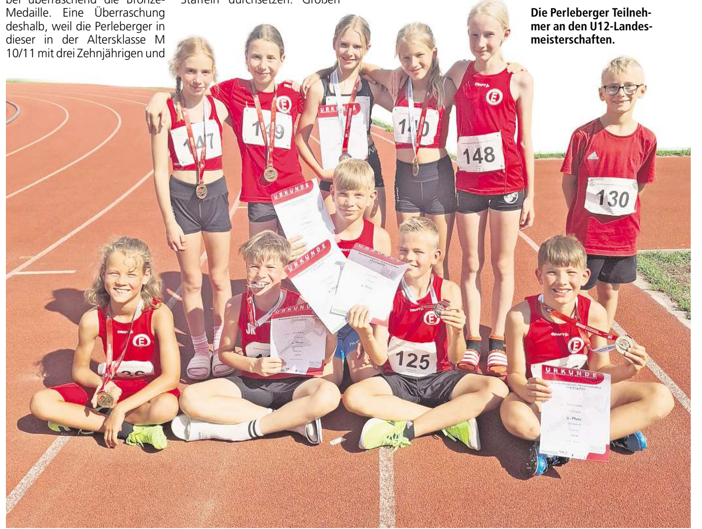
Die Perleberger Teilnehmer an den U12-Landesmeisterschaften.