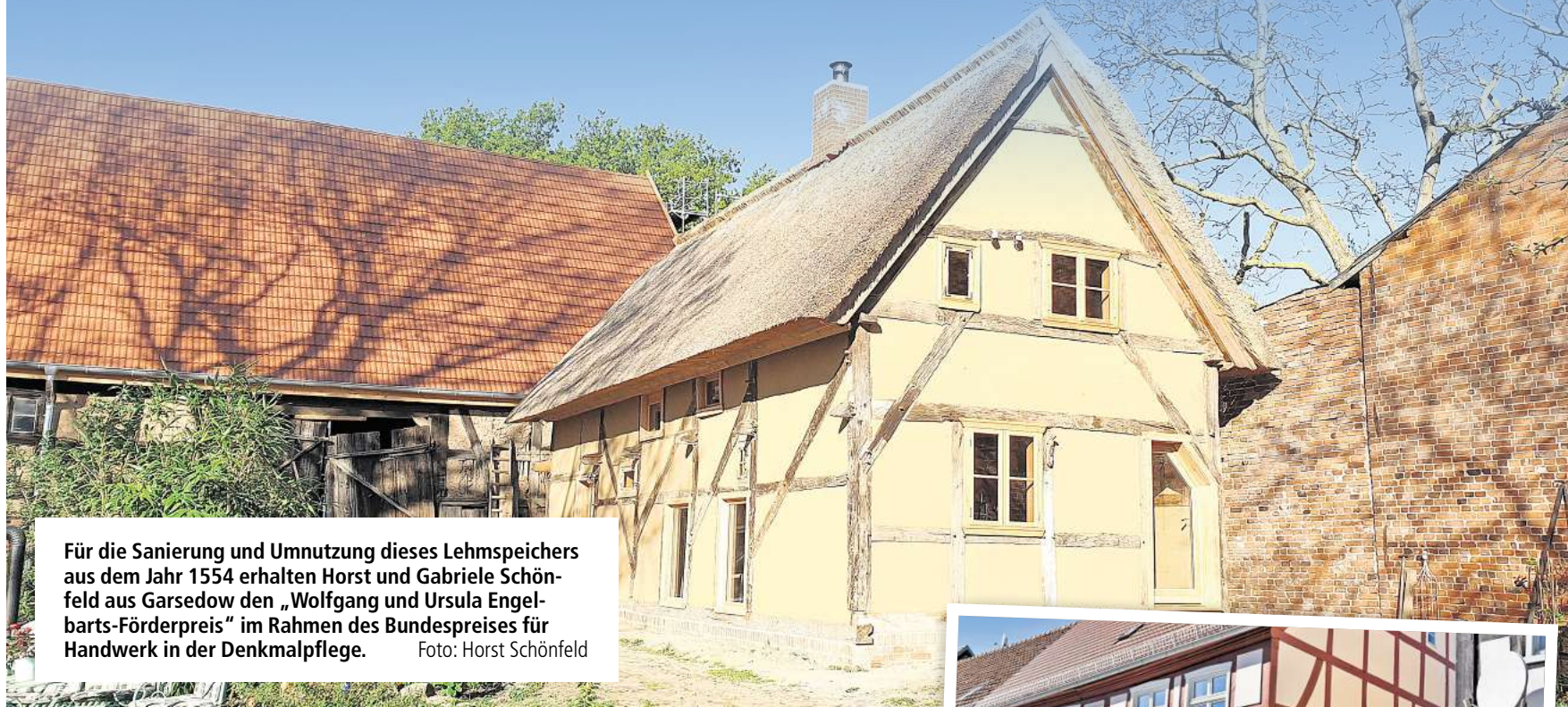
Für die Sanierung und Umnutzung dieses Lehmspeichers aus dem Jahr 1554 erhalten Horst und Gabriele Schönfeld aus Garsedow den „Wolfgang und Ursula Engelbarts-Förderpreis“ im Rahmen des Bundespreises für Handwerk in der Denkmalpflege.

Die prämierten Objekte sind ein Lehm Speicher in Garsedow und ein Fachwerkhaus in Lenzen