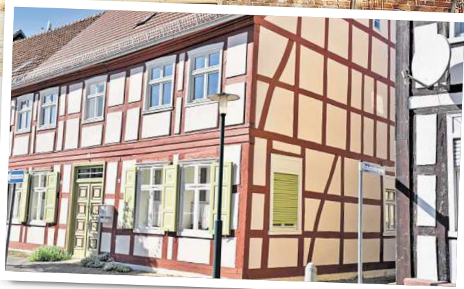
älteste bekannte Speicher der Prignitz und des Landes Brandenburg.

Dem Speicher in Garsedow, einem Fachwerkgebäude, dessen Bedeutung für den Denkmalbestand und die Kulturlandschaft des Landes Brandenburg mittlerweile von großer Wichtigkeit ist, kam bei der Gesamtsanierung der gesamten Hofanlage in Garsedow eine tragende und wichtige Rolle zu. Seine Erbauungszeit wurde ursprünglich im 19. Jahrhundert vermutet. Die wissenschaftliche Untersuchung der Fachwerkhölzer ergab jedoch 1554 als Jahr der Erbauung – das kleine Bauwerk war also zu Zeiten der Reformation entstanden. Damit ist er der