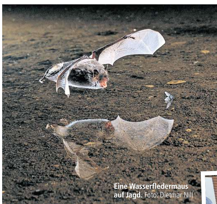
Eine Wasserfledermaus auf Jagd.

Die Batnight im NABU-Besucherzentrum ist ein Naturerlebnis für Familien