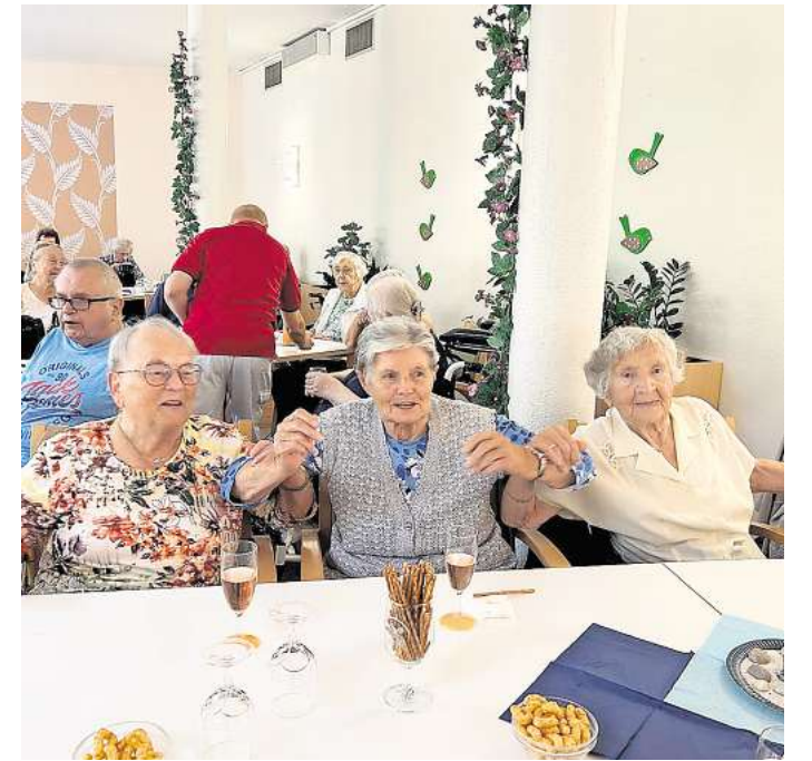
Die Senioren in der DRK-Einrichtung „Lebenskreis“ freuen sich über die vielfältigen, gemeinsamen Aktivitäten.