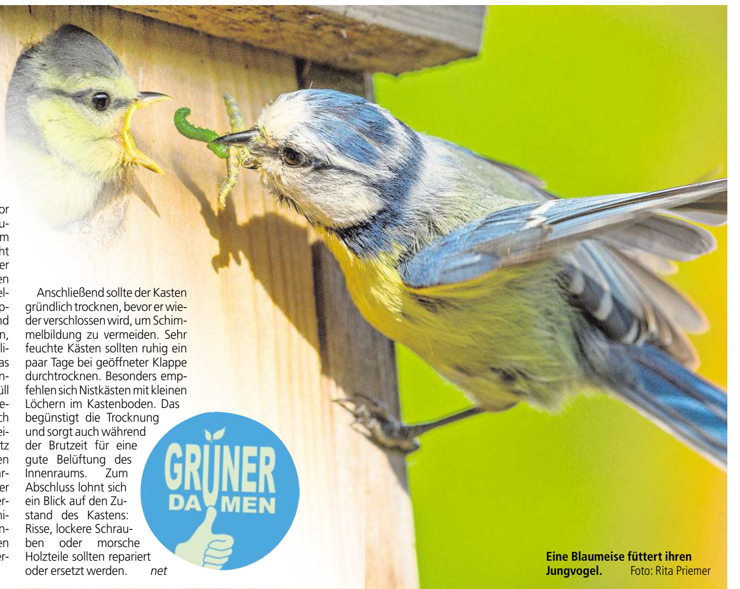
Eine Blaumeise füttert ihren Jungvögel.

Anschließend sollte der Kasten gründlich trocknen, bevor er wieder verschlossen wird, um Schimmelbildung zu vermeiden. Sehr feuchte Kästen sollten ruhig ein paar Tage bei geöffneter Klappe durchtrocknen. Besonders empfehlen sich Nistkästen mit kleinen Löchern im Kastenboden. Das begünstigt die Trocknung und sorgt auch während der Brutzeit für eine gute Belüftung des Innenraums. Zum Abschluss lohnt sich ein Blick auf den Zustand des Kastens: Risse, lockere Schrauben oder morsche Holzteile sollten repariert oder ersetzt werden. net