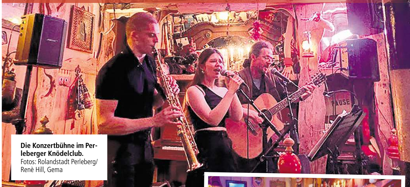
Die Konzertbühne im Perleberger Knödelclub.

Perleberger Musikclub ist als „Musikkneipe des Jahres 2025“ nominiert – als einziger in Brandenburg