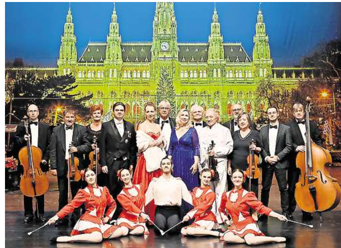
Eingängige Melodien und beschwingte Leichtigkeit: das Gala Sinfonieorchester Prag spielt Operetten-Klassiker.

Die Operette begeistert seit fast zwei Jahrhunderten mit ihren eingängigen Melodien und ihrer beschwingten Leichtigkeit. Mit kraftvoller Eleganz, romantischer Gefühlstiefe und einem authentischen Klangbild lassen die Musiker des Gala Sin-