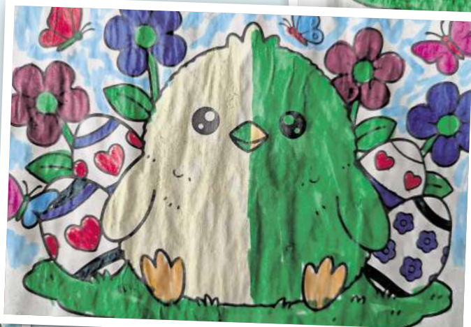
Theodor Kong, 8 Jahre, aus Weisen.