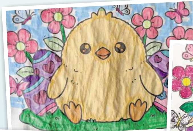
Nora Kong, 10 Jahre, aus Weisen.