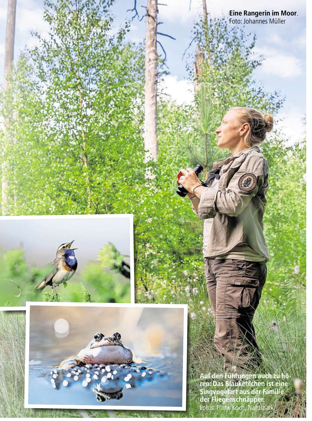
Eine Rangerin im Moor.

Die Führungen der Naturwacht sind kostenfrei. Anmeldung erforderlich unter elbtalae@naturwacht.de. Weitere Informationen unter: www.naturschutzfonds.de/natur-erleben/konzertfruehling