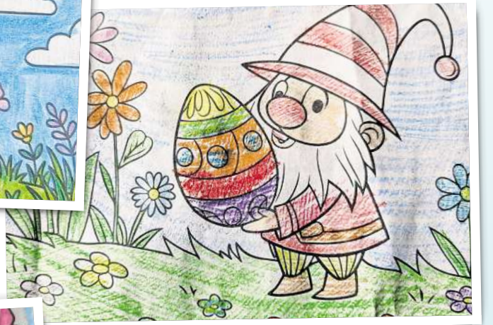
Ilana Lübke, 10 Jahre, aus Wittstock/Dosse.