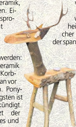
Dieser tierische Zeitgenosse begrüßt Besucher vor der Märchenstube auf dem Gelände.

se bekommen“, so Mathias Höpfner. Den Ofen kann man, wie die weiteren Räumlichkeiten auf der Anlage, für private Feiern und Zusammenkünfte mieten. Organisatorisch soll der erste Markt bewusst niedrigschwellig bleiben: Weder Eintritt noch Standgebühren werden erhoben. Den Kuchen backen dieses Mal engagierte Menschen aus dem Dorf. Wer den Ausflug größer planen will, kann ihn sogar mit den Osterfahrten der Prignitzer Museumsbahn verbinden. Die traditionelle Ostertour des „Pollo“, einer historischen Diesellok, führt von Lindenberg nach Brünkendorf und zurück. Im anliegenden „Märchenwald“ verstecken sich auch dieses Jahr Oster-Überraschungen für Kinder. „Von Brünkendorf sind wir nur einen Spaziergang entfernt“, sagt Mathias Höpfner, „der Weg dürfte sich insbesondere für Familien lohnen“.