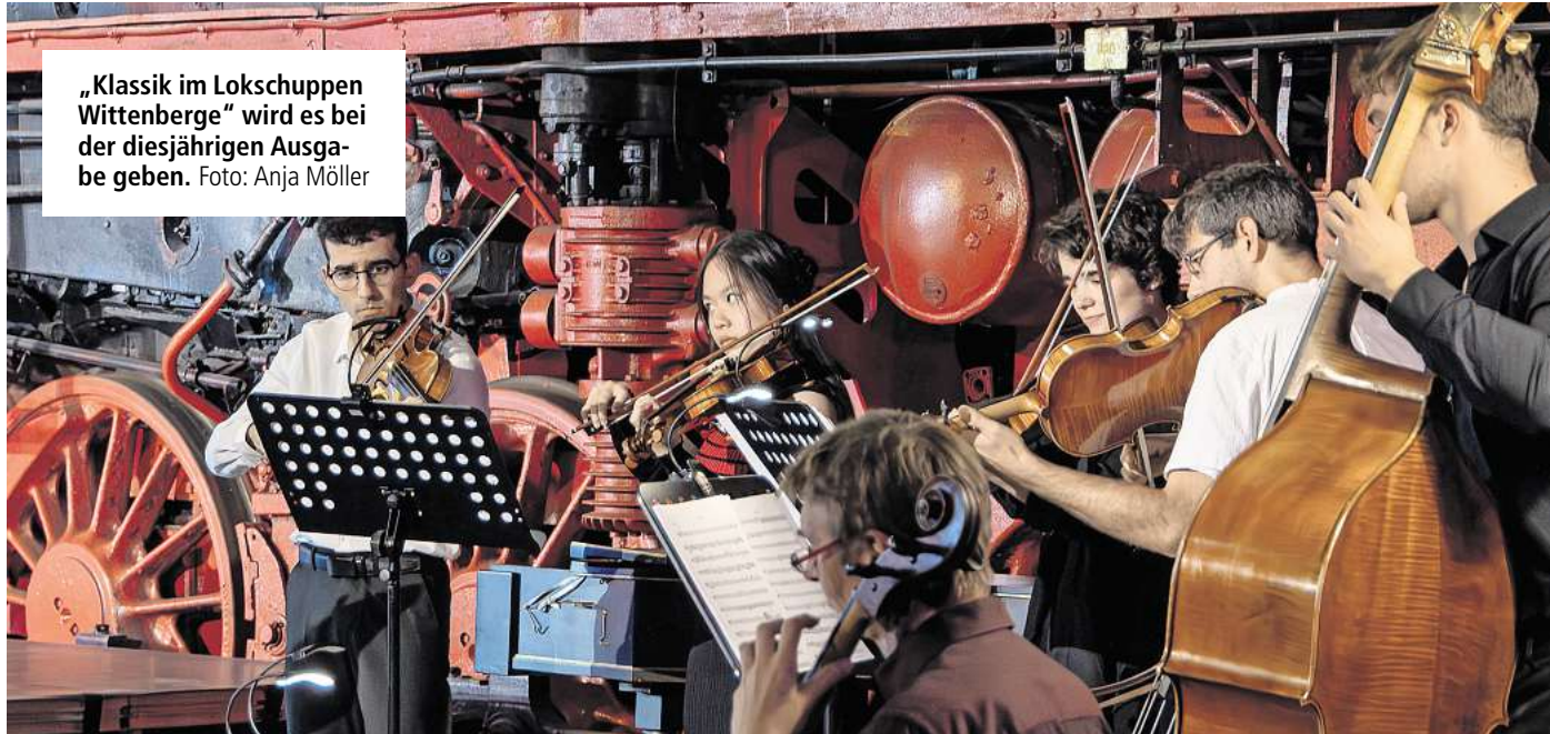
„Klassik im Lokschuppen Wittenberge“ wird es bei der diesjährigen Ausgabe geben.

Das gesamte Wochenspiegel-Team sagt Danke und wünscht allen Leserinnen und Lesern sowie Geschäftspartnerinnen und Geschäftspartnern ein frohes Osterfest.