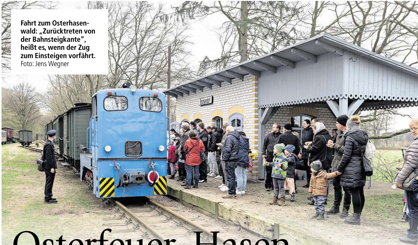
Fahrt zum Osterhasenwald: „Zurücktreten von der Bahnsteigkante“, heißt es, wenn der Zug zum Einsteigen vorfährt.