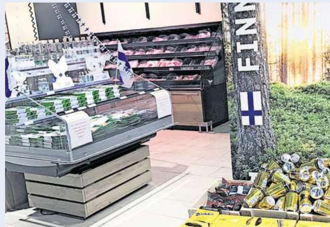
Während der Aktionswoche wird die Bandbreite finnischer Produkte im Markt sichtbar.

Dass Finnland im Wittenberger Markt präsent ist, hat eine längere Geschichte. Das Unternehmen arbeitet seit Jahren mit einer finnischen Unternehmensberaterin zusammen, die Kontakte zu finnischen Herstellern aufbaut und pflegt. Diese Kooperation führte bereits zu persönlichen Einblicken vor Ort. „Wir waren schon in Finnland und konnten Produzenten kennenlernen sowie den Einzelhandel dort erleben“, berichtet Jens Bockelmann. Die Eindrücke prägen bis heute die Auswahl im Markt. Die Woche bietet eine kulinarische Entdeckungsreise in den Norden. dre