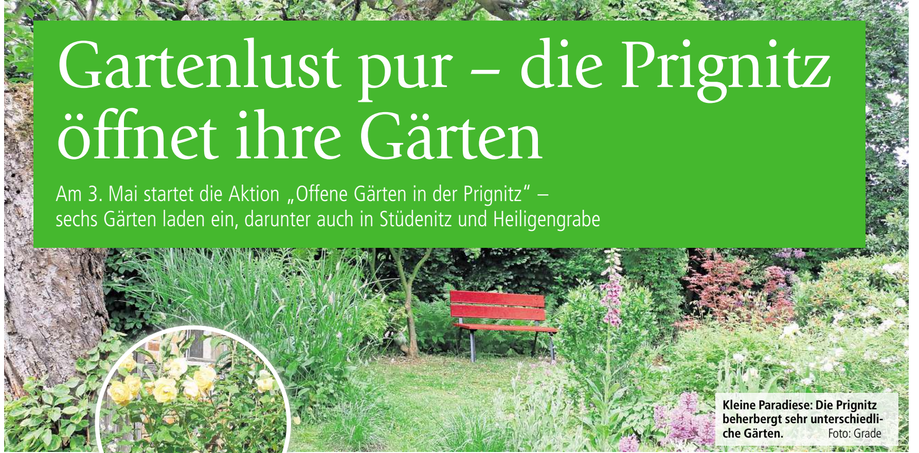
Kleine Paradiese: Die Prignitz beherbergt sehr unterschiedliche Gärten.

Am 3. Mai startet die Aktion „Offene Gärten in der Prignitz“ – sechs Gärten laden ein, darunter auch in Stüdenitz und Heiligengrabe