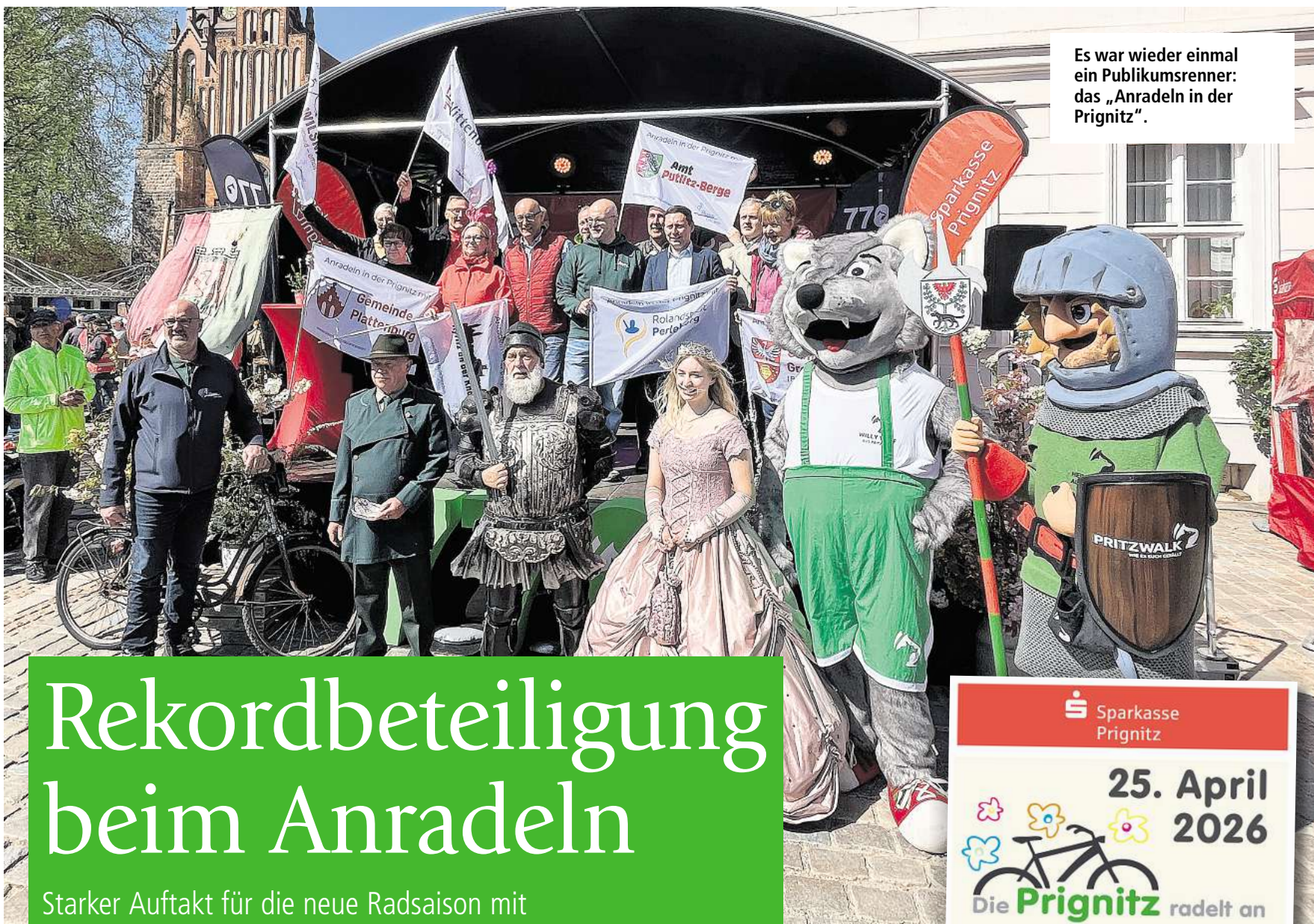
Es war wieder einmal ein Publikumsrenner: das „Anradeln in der Prignitz“.