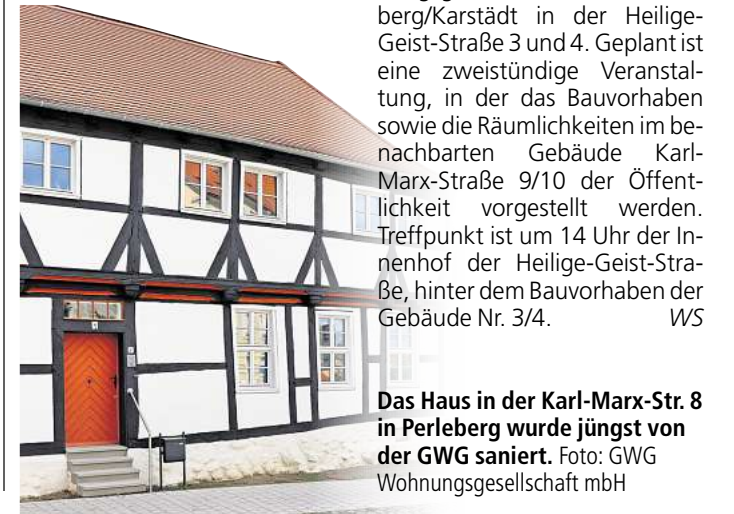
Das Haus in der Karl-Marx-Str. 8 in Perleberg wurde jüngst von der GWG saniert.

schaften“ und legt den Fokus auf die Wirkung der Städtebauförderung vor Ort. Die Stadt Perleberg präsentiert das aktuelle Bauprojekt der GWG Wohnungsgesellschaft mbH Perleberg/Karlstadt in der Heilige-Geist-Straße 3 und 4. Geplant ist eine zweistöckige Veranstaltung, in der das Bauvorhaben sowie die Räumlichkeiten im benachbarten Gebäude Karl-Marx-Straße 9/10 der Öffentlichkeit vorgestellt werden. Treffpunkt ist um 14 Uhr der Innenhof der Heilige-Geist-Straße, hinter dem Bauvorhaben der Gebäude Nr. 3/4. WS