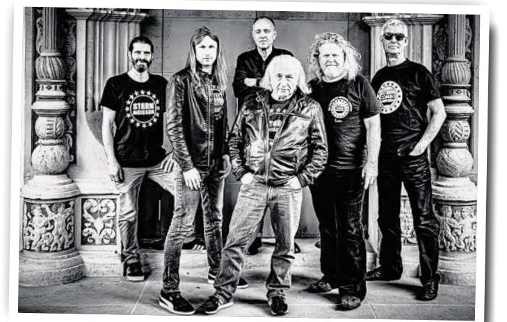
Artrock mit Stil: Die Stern-Combo Meissen gastiert im Oktober in Wittenberge.

Tickets gibt es in der Touristinformation Wittenberge, Tel. 03877/9291-81/-82, via E-Mail: tickets@kulturhaus-wittenberge.de oder online über www.kulturhaus-wittenberge.de