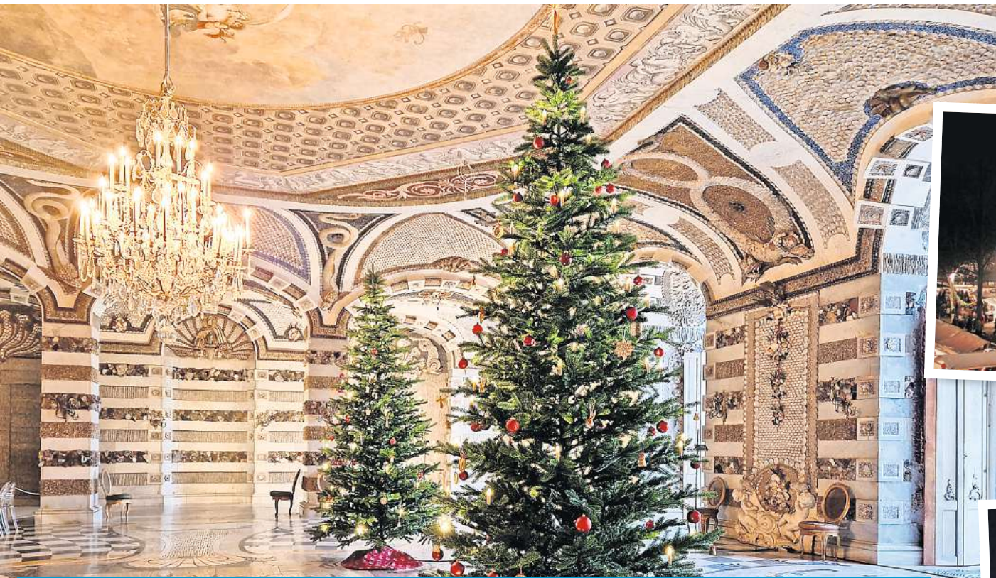
Kaiser Wilhelm II. und seine Familie feierten das Weihnachtsfest im Gartensaal des Neuen Palais.