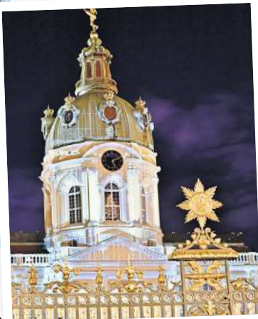
Der Weihnachtsmarkt am Schloss Charlottenburg ist besonders romantisch.