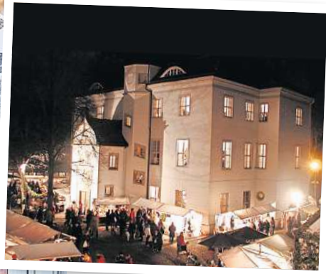
Das Jagdschloss Grunewald lädt nach dreijähriger Pause wieder zu einem Weihnachtsmarkt ein.