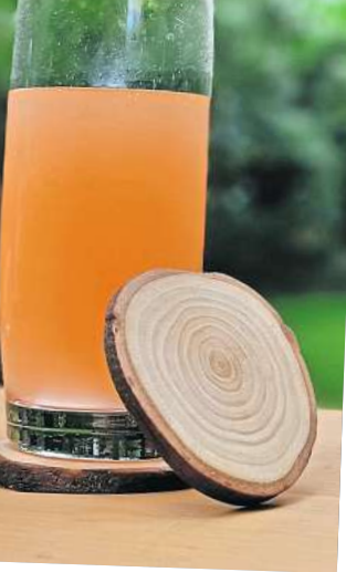
Tannennadeln lassen sich auch in oder für Getränke nutzen.

ßen Pflanzenfresser wie Elefanten, Rotwild oder Kamele. Aber nicht nur den Zootieren schmeckt der Weihnachtsbaum. Auch für viele Haustiere, so zum Beispiel Schafe oder Ziegen, ist das nadelige Grün ein wahrer Hochgenuss. Die Zweige können darüber hinaus auch für die Ausstattung von Terrarien, Folieren und Gehegen genutzt werden, beispielsweise als Sitzstangen für Vögel, Echsen oder Eichhörnchen. Als Spielzeug werden Äste und Zweige von Tannenbäumen von bald jedem Tier in Zoo, Wildpark und Privathaltung sehr geschätzt. WS