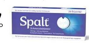
Abbildung Betroffenen nachempfunden. SPALT SCHMERZTABLETTEN. Für Erwachsene bei: akuten leichten bis mäßig starken Schmerzen. Schmerzmittel sollen längere Zeit oder in höheren Dosen nicht ohne Befragen des Arztes angewendet werden. Bei Schmerzen oder Fieber ohne ärztlichen Rat nicht länger anwenden als in der Packungsbeilage vorgegeben! www.spalt-online.de • Zu Risiken und Nebenwirkungen lesen Sie die Packungsbeilage und fragen Sie Ihre Ärztin, Ihren Arzt oder in Ihrer Apotheke. • PharmaSGP GmbH, 82166 Gräfelfing

Für Ihre Apotheke: Spalt Schmerztabletten (PZN 08689834)