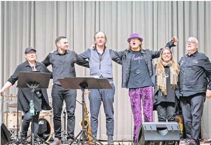
15 Jahre Uwes Musikschule: Gefei-ert wird am Samstag, dem 20. Januar, mit einem Konzert des Jazz-Clubs in Olafs Werk-statt.

Konzert am 20. Januar in Olafs Werkstatt in Neustadt / Dosse