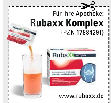
(Abbildung Betroffenen nachempfunden)

Das Fazit einer begeisterten Anwenderin: „Für mich das Beste!“