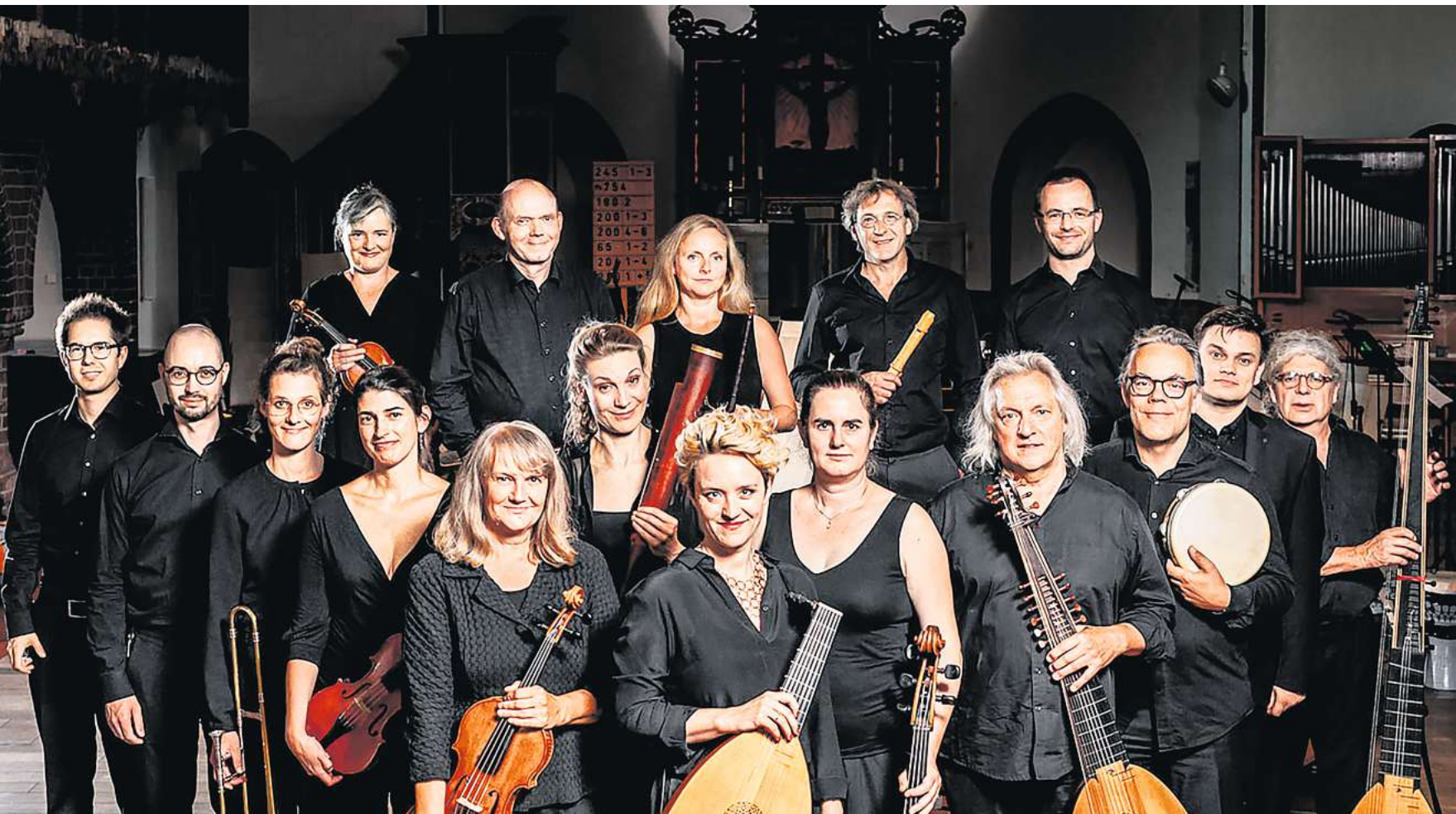
Die lauten compagney aus Berlin eröffnen die Aequinox-Musiktage am 15. März.