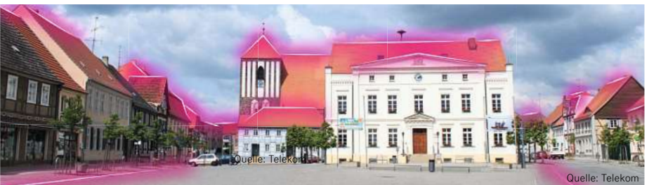
Für rund 1.600 Haushalte in Wusterhausen/Dosse baut die Telekom Glasfaserleitungen aus.

einer besseren Leistung Ihres Anschlusses. Der Wechsel von einem anderen Anbieter zur Telekom ist mit dem kostenfreien Wechsel-Service sehr einfach möglich. Die Telekom führt die Kündigung beim bisherigen Anbieter durch und stellt Ihren Anschluss zeitgerecht um.