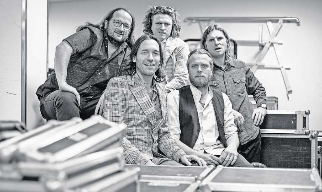
Benefizkonzert mit der Magical Mystery Band am Freitag, dem 19. April, im Kultur- und Festspielhaus Wittenberge.

Magical Mystery Band spielt Pink Floyd im Festspielhaus Wittenberge