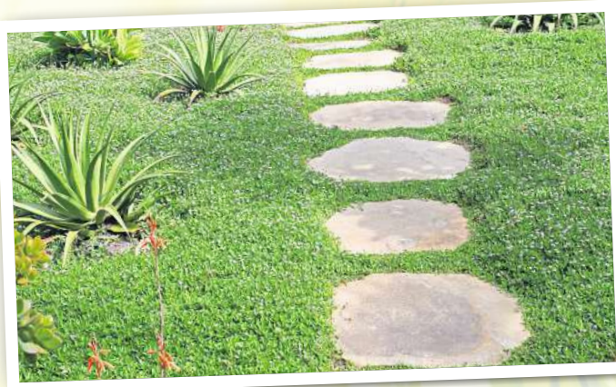
Für viele eine gute Lösung: Bodendecker.