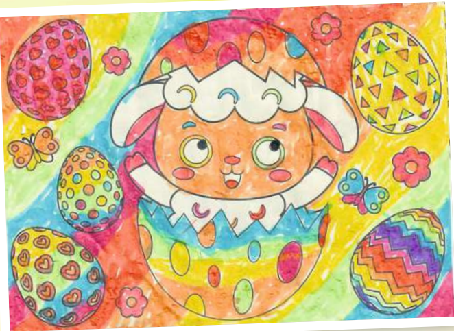
Greta Bohn (7) aus Groß Lüben.