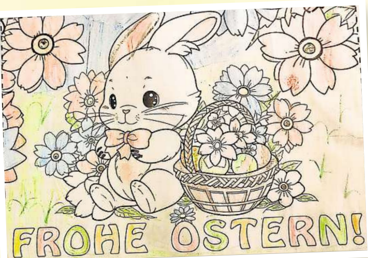
Laura Koch (9) aus Neustadt (Dosse).