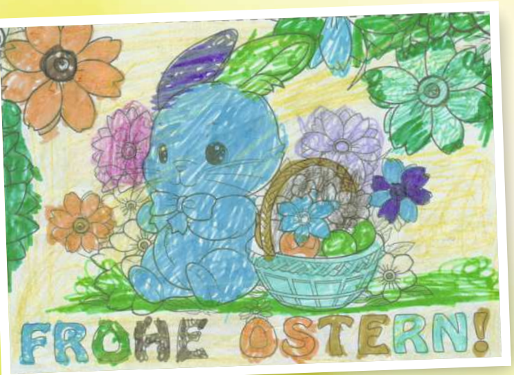
Merve Polat (5) aus Wusterhausen/Dosse.