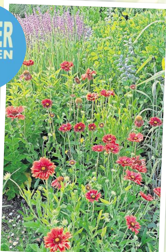
Augenweide: Die Kokardenblume (Gaillardia x grandiflora, hier im Farbton Burgunder) zieht mit ihrer Blüte von Juli bis September die volle Aufmerksamkeit auf sich.