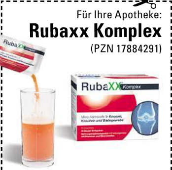
(Abbildung Betroffenen nachempfunden)

Fragen Sie in Ihrer Apotheke nach Rubaxx Komplex (frei verkäuflich erhältlich)!