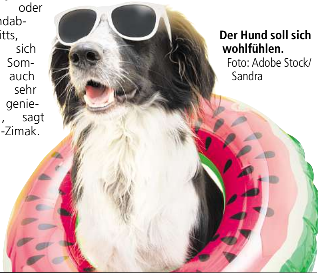
Der Hund soll sich wohlfühlen.

„Für den nächsten Urlaub empfiehlt es sich dann, langfristig zu planen, damit der Hund gut versorgt ist. Spontan und zur Hauptreisezeit ist es schwierig, einen sachkundigen Tiersitter zu finden.“ WS