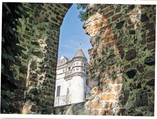
Das Gemäuer von Schloss Freyenstein stammt aus dem Jahr 1556.