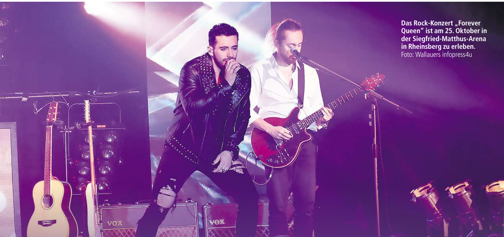
Das Rock-Konzert „Forever Queen“ ist am 25. Oktober in der Siegfried-Matthus-Arena in Rheinsberg zu erleben.