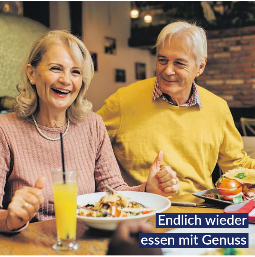
Endlich wieder essen mit Genuss

Bei Blähungen, Völlegefühl und Magenkrämpfen bringen GASTEO Magen-Tropfen mit sechs