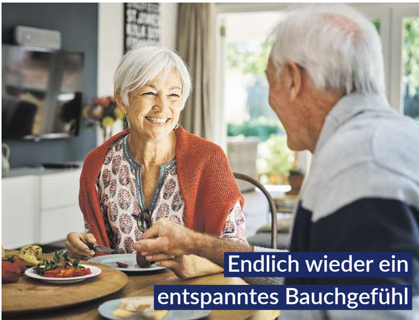
Endlich wieder ein entspanntes Bauchgefühl

Magen-Tropfen, sorgen sechs clever kombinierte natürliche Wirkstoffe für eine deutlich spürbare, schnelle „Erste Magen- und Verdauungshilfe“. Bitterstoffe aus Wermut-, Benediktenkraut und Angelikawurzel steigern rasch die Speichelproduktion und stoßen im Magen-Darm-Trakt die Produktion von Gallensaft und Magensäure an. 1,2 Dank Gänsefingerkraut, Süßholzwurzel sowie Kamillenblüten entspannen Magen und Darm.