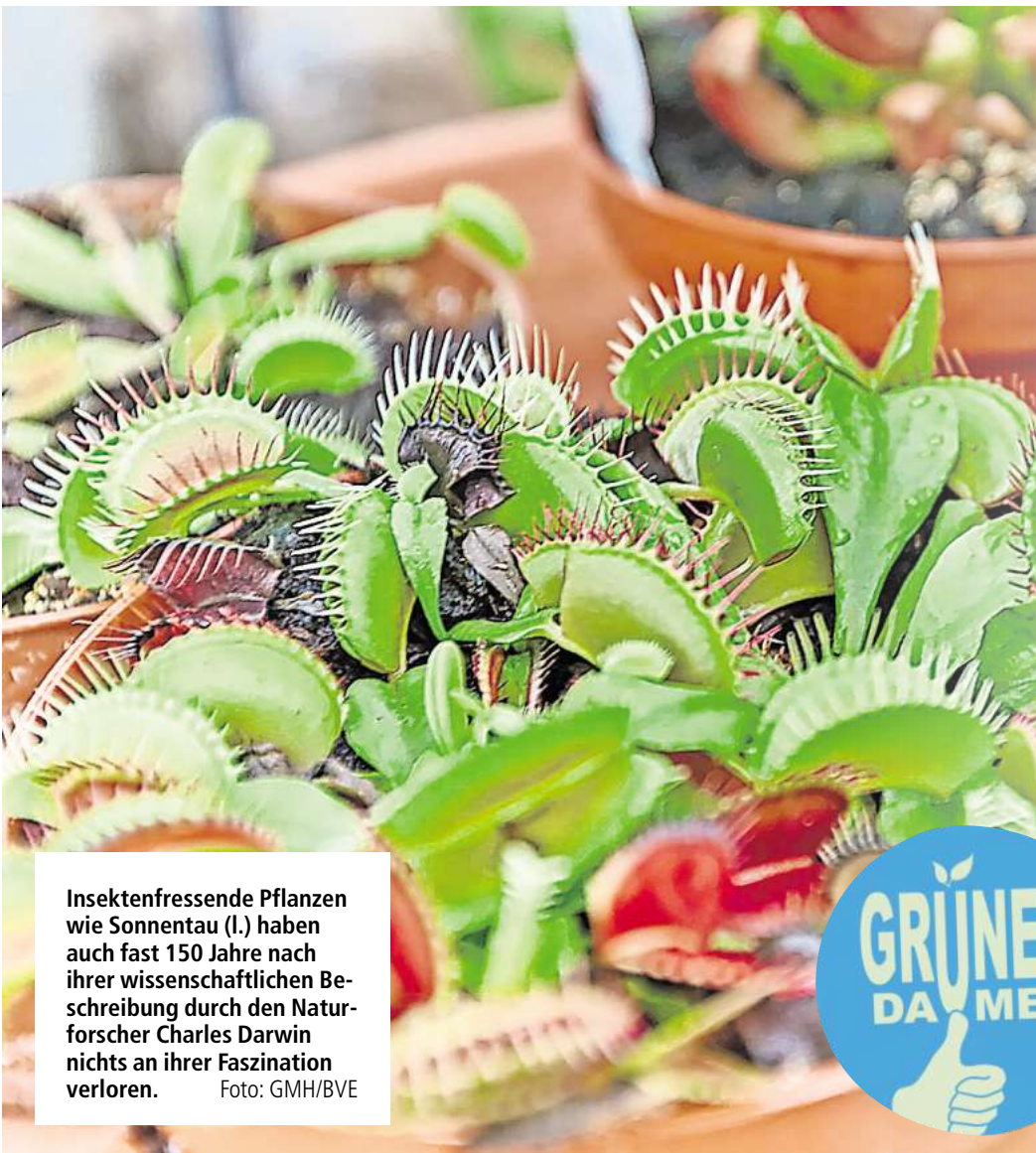
Insektenfressende Pflanzen wie Sonnentau (l.) haben auch fast 150 Jahre nach ihrer wissenschaftlichen Beschreibung durch den Naturforscher Charles Darwin nichts an ihrer Faszination verloren.