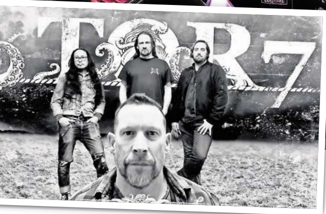
„Tor 7“ ist eine internationale Band mit Mitgliedern aus Wales, Deutschland, den Philippinen und Australien.

Künstlern und Bands eine Plattform – verbunden mit einer Spendenaktion. In den vergangenen Jahren gingen die Spenden an den Ostprignitz-Jugend e.V. und die Trauergruppe „Lumina“. Wer sich in diesem Jahr über eine Spende freuen kann, wird erst zur Rocknacht verkündet. Neben einem Newcomer werden in diesem Jahr die Bands Pöbel Goethe aus Mecklenburg,