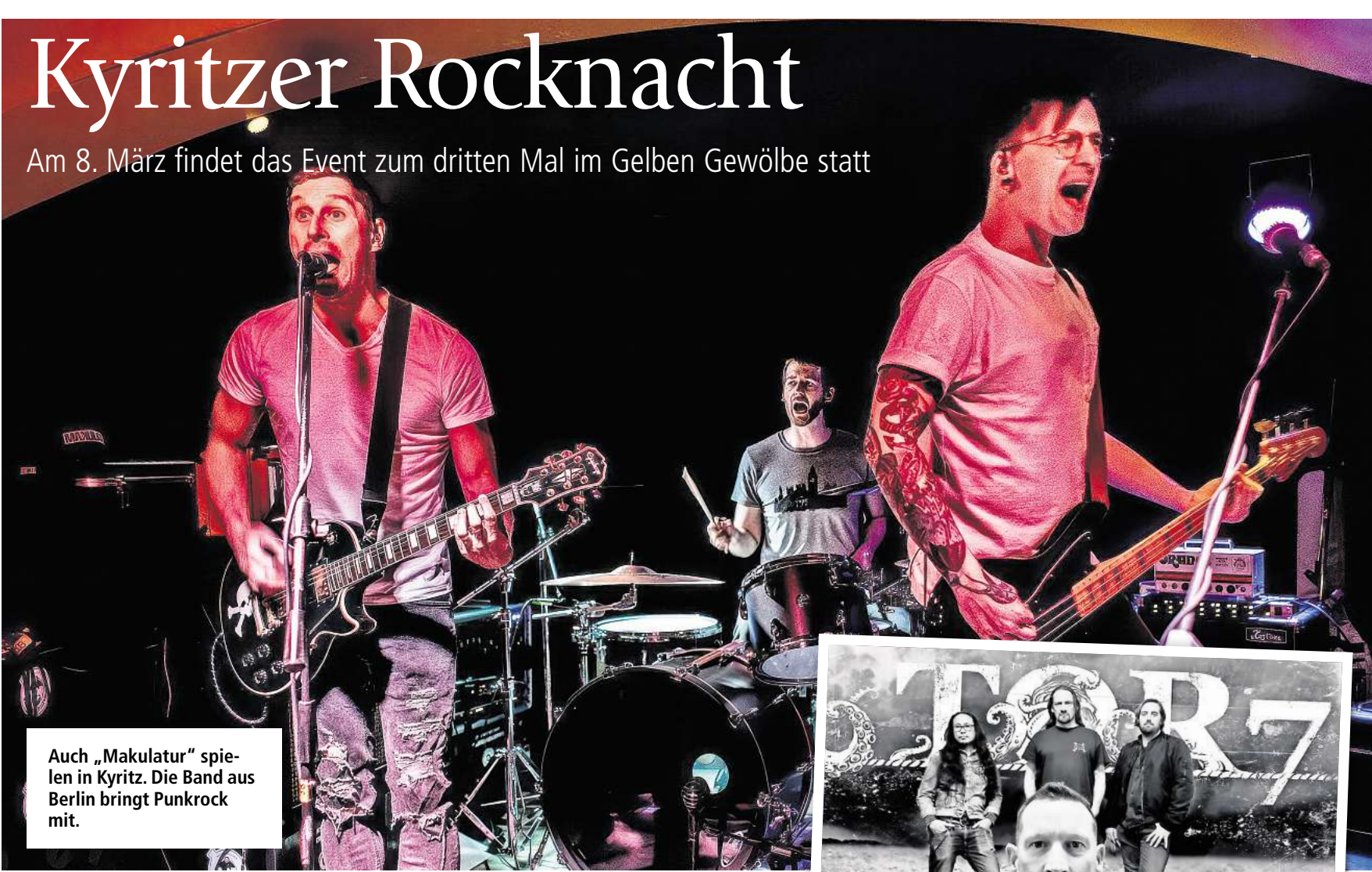
Auch „Makulatur“ spielen in Kyritz. Die Band aus Berlin bringt Punkrock mit.