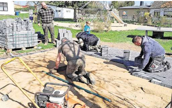
Eine Stele und eine Bankgruppe entstehen zur Zeit in Rehfeld.

Ernst Stadtkus wurde 1905 in Rehfeld geboren und lebte dort bis zu seinem Tod im Jahr 1987. In seinen Werken hat er hauptsächlich die niederdeutsche