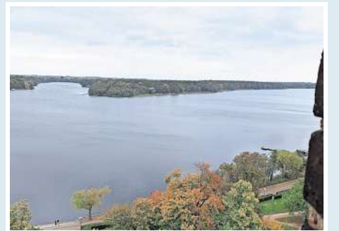
Der Blick vom seeseitigen Turm der Klosterkirche reicht weit über den Ruppiner See, der mit einer Länge von 14 Kilometern der längste See Brandenburgs ist, und über die Neuruppiner Innenstadt.