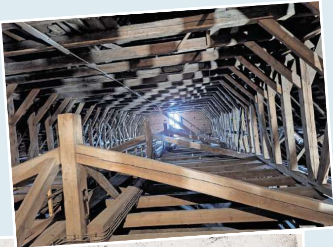
Ein Blick auf die aufwendige Dachstuhlkonstruktion, die notwendig ist, um das Kirchendach zu tragen.