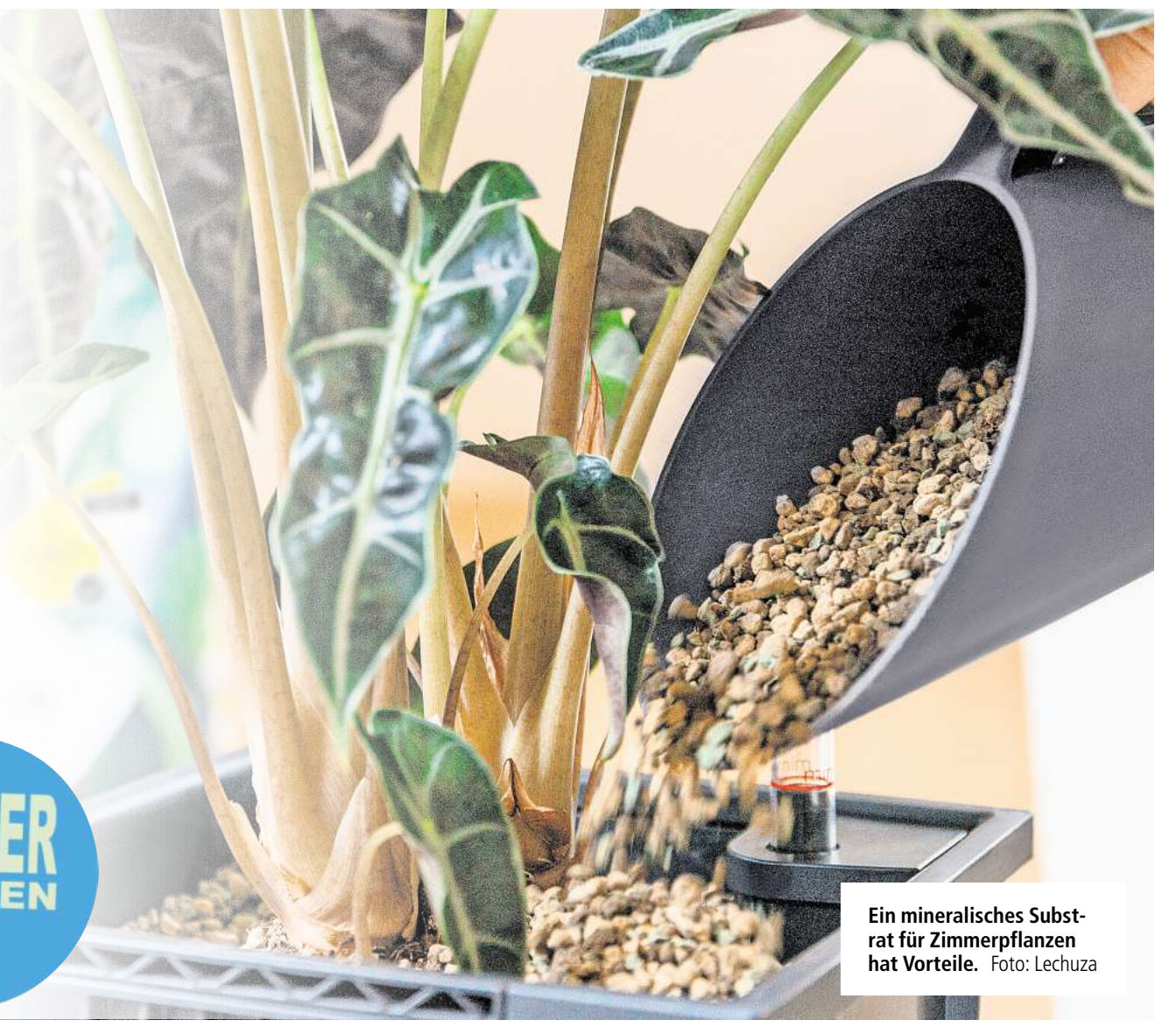
Ein mineralisches Substrat für Zimmerpflanzen hat Vorteile.