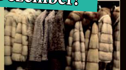
Für Pelze und nerze bis zu 12.000€

Ankauf von: Goldschmuck, Armbänder, bevorzugt in breiter Form Ketten, Ringe, auch defekt, Zahngold, mit und ohne Zähne, Weißgold, Goldmünzen, Thaler, Medaillen, auch defekte, Münzen, Goldbarren, Nuggets, Schmelzgold, Platin, Schmuck, Münzen, Schmelzplatin, Paladium