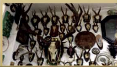
Geweibe mit Höchstpreisen von 1200,- €

Ankauf von: Pelze, Felle, Mützen, Schals, Lederjacken, Ledertaschen, Dirndl, Trachten, Geweihe, Hummel, Goebel Kristalle, Gläser, Teller, Vasen, Geschirr, Sets, auch einzeln Antike Möbel, Ölgemälden, Bronzen, Porzellan, Puppen, Orientteppiche, Instrument, Piano, Orgel, Trompete Charivari, u.v.m.