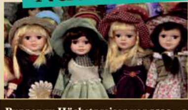
Puppen zu Höchstpreisen von 1500,- €