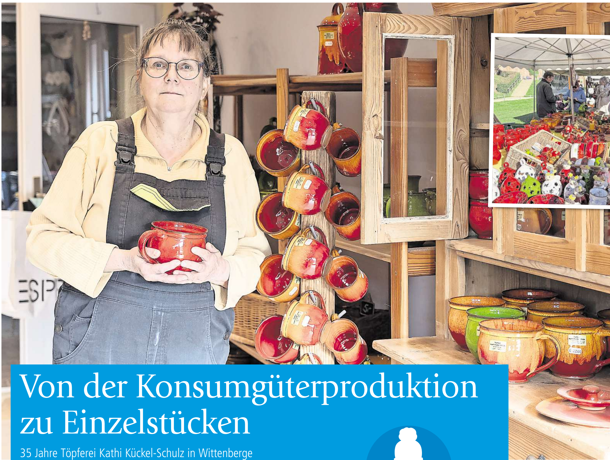
Den meisten Umsatz macht sie auf Märkten wie auf dem Töpfermarkt in Tangermünde.