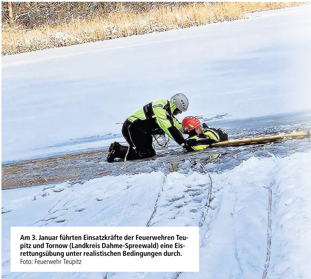
Am 3. Januar führten Einsatzkräfte der Feuerwehren Teupitz und Tornow (Landkreis Dahme-Spreewald) eine Eisrettungsübung unter realistischen Bedingungen durch.