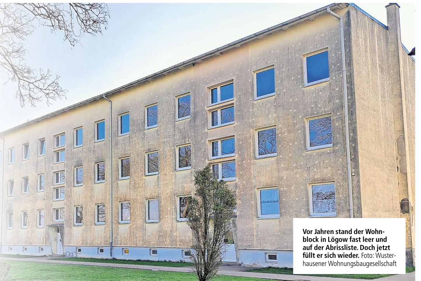
Vor Jahren stand der Wohnblock in Lögow fast leer und auf der Abrissliste. Doch jetzt füllt er sich wieder.

Nachfragen potenzieller Mieter nehme man gerne an. „Ich habe noch 45 Wohnungen frei.“ Unter anderem eben in Lögow, Brunn und Schönberg. „Vereinzelt gibt es auch noch was in der Stadt.“ Die Wohnungsbaugesellschaft will im Laufe des Jahres nachlegen. „Wir planen, fünf Wohnungen zu dreien zusammenzulegen – größer und besser ausgestattet.“ Außerdem stehe eine Investition an, die das Unternehmen seit Jahren nicht hatte: „Wir werden in Wusterhausen ein ganz neues Haus bauen. Da wollen wir mindestens vier Wohnungen schaffen.“ Fest steht: So billig wie die „Platte“ wird das nicht zu haben sein. Neubau bleibt auch auf dem Land teuer. Alexander Beckmann