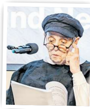
Katharina Thalbach liest.